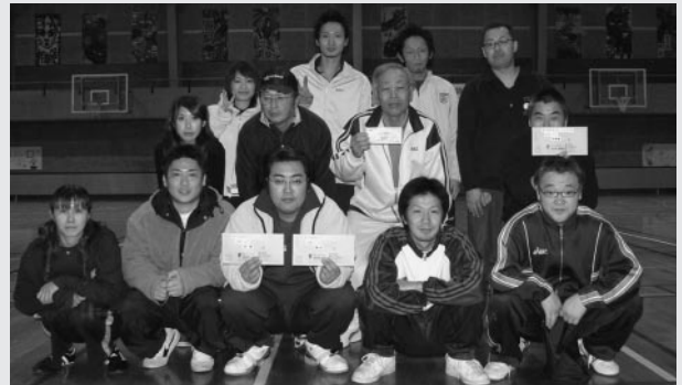
優勝(前列)、準優勝(2列目)、第3位(3列目)