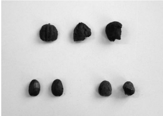
写真① クルミとドングリの実