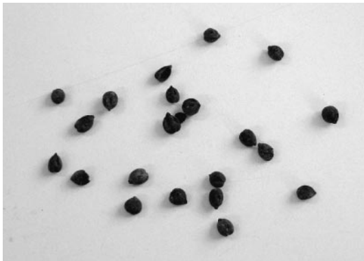
写真② ヤマブドウの種