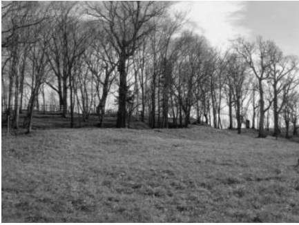
整備中の史跡ユクエピラチャシ跡 活用整備が今後の課題となっている。

文化財について① これまでチャシを中心に町内の遺跡の話をしてきましたが、今月は少し文化財そのものについて話をしてみたいと思います。 現在の文化財保護法では、文化財を有形文化財、無形文化財、民俗文化財、記念物、文化的景観、伝統的建造物群に分類しています。ユクエピラチャシ跡のような史跡は記念物に属します。 ところで、なぜ私たちは文化財を保護しなければならないのでしょうか？ これらの文化財を保護す