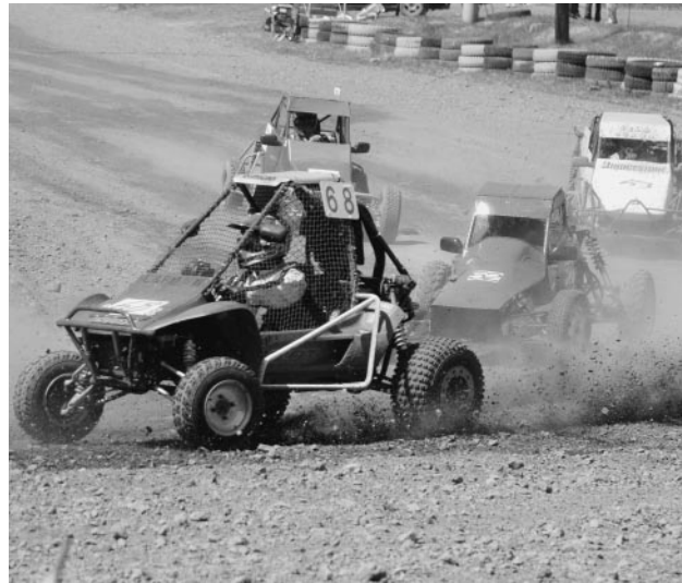
石とほこりを巻き上げ熱戦を繰り広げるバギー車(上)とATV(下)