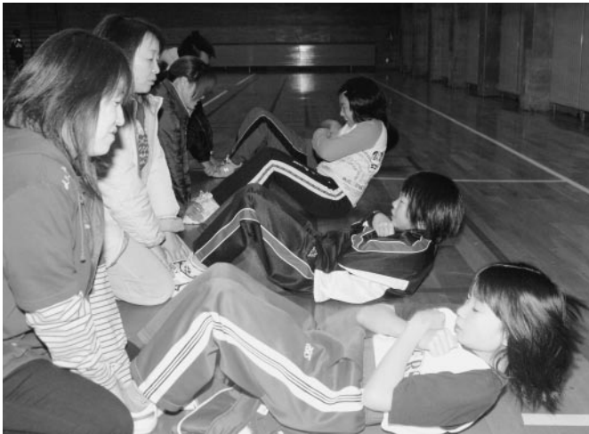
▲陸別町スポーツ少年団恒例の体カテストが、陸別中学校体育館を会場に行われました。当日は各スポーツ少年団員を中心に30人余りが握力や上体起こし、反復横とびなど6種目に挑戦し、自分の体力の限界に挑んでいました。(11/19・陸中体育館)