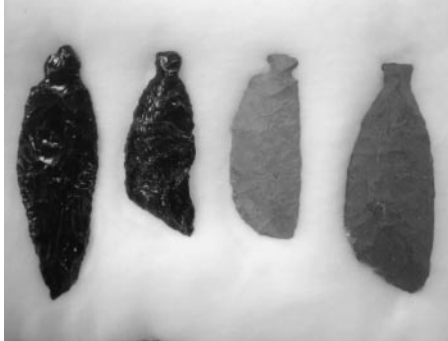
写真③ つまみ付ナイフ