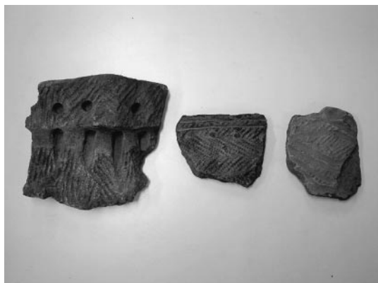
写真② 陸別町出土の土器（後期～晩期）