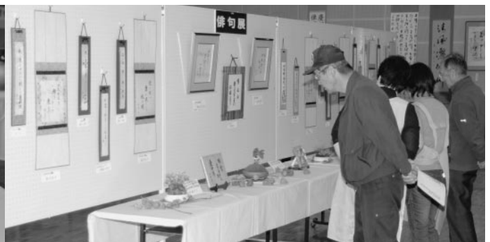
陶趣会の作品も展示され、ボランティアセールも行われました（庁舎町民ロビー）