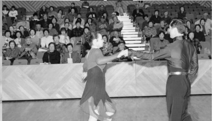
カラオケや踊りなど多くの発表がありました（タウンホール）