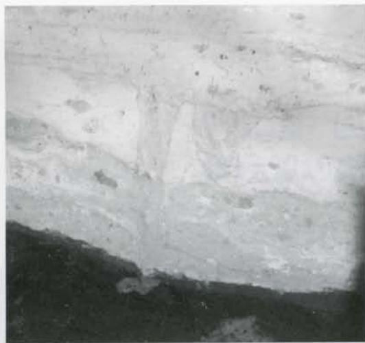
写真② 柵列の柱と溝の断面