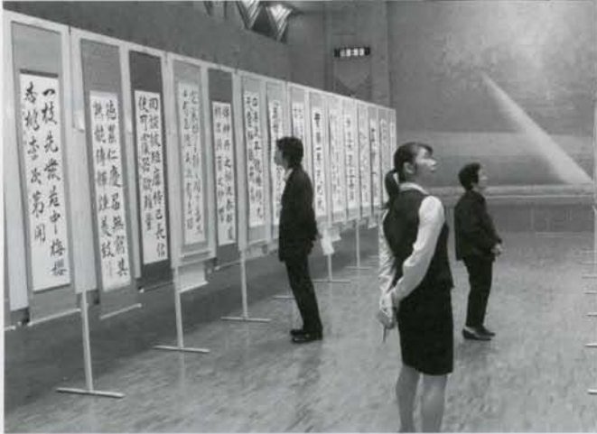
十勝芸術祭の書道展が開かれました