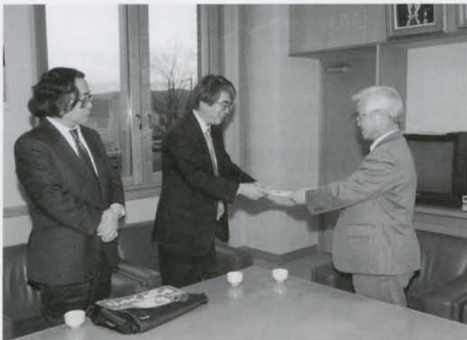
ラリージャパン実行委員会から緑化推進資金として20万円が寄付されました