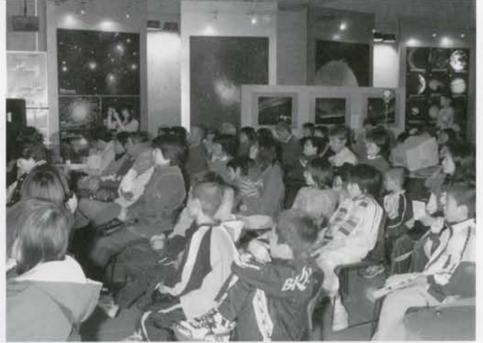
オーロラウィーク2004 たくさん参加されました