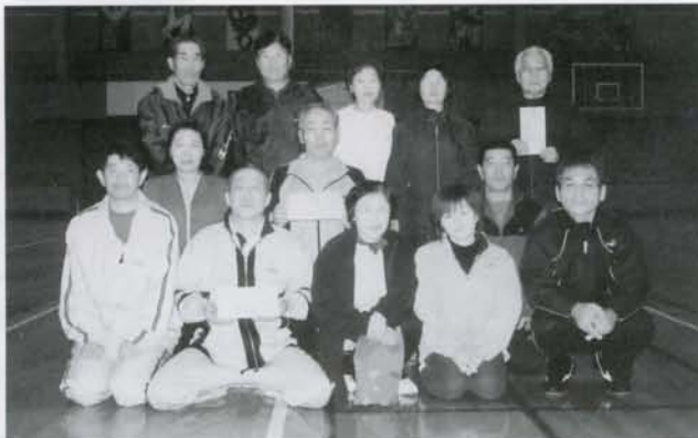
フロアーリング優勝～第3位入賞チーム