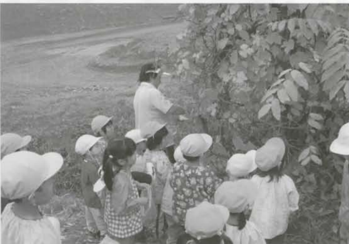
保育所で秋の遠足が行われ、ぶどう採りなどを楽しみました。