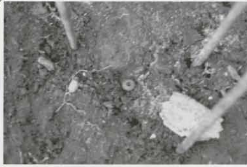
写真① 装飾品出土状況

写真①の中央に見えるのは真ん中に穴があいている小さなピリスのような装飾品です。首飾