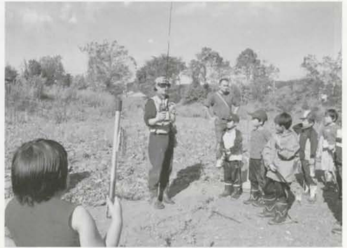
将来、太公望になれるかな？ 「わくわく体験」釣り教室が行われました。