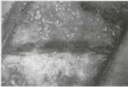
写真② 炭化材出土状況