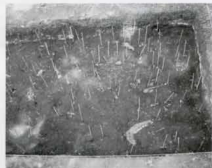
写真③ シカの骨の出土状況