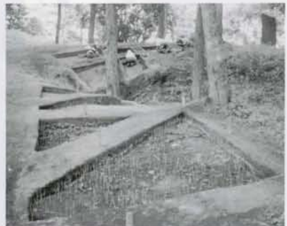
写真② 遺物の出土状況と調査風景