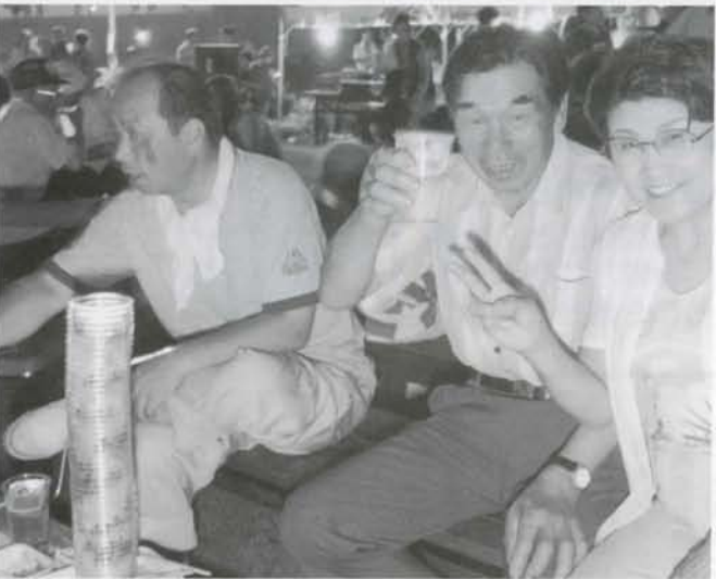
商工会青年部によるビアガーデン屋台村がオープン。暑さもあってビールがどんどん売れました。過去最高の消費量だったそうです。