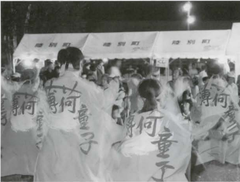
スタンプ会によるナイトバザールが開催されました。北見市から「薄荷童子」が招かれよさこいが披露されました。