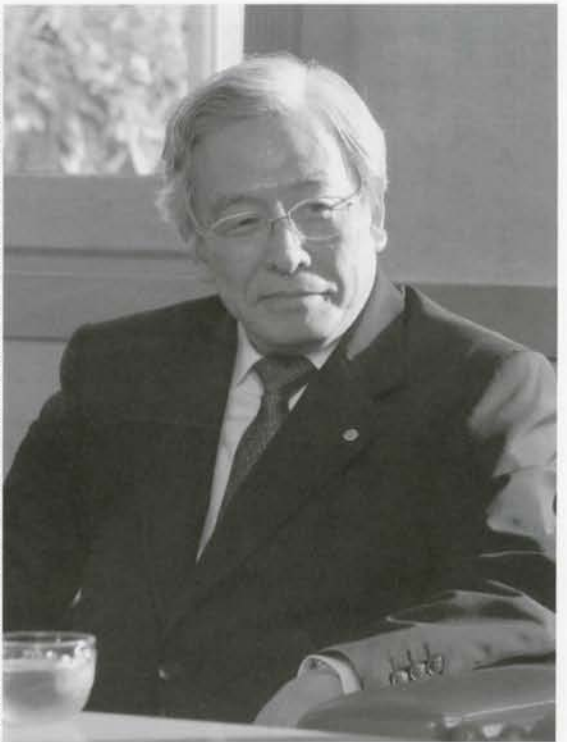
日産自動車株式会社取締役共同会長が役場に訪れ、イベント用ベンチ20脚などが寄付されました。