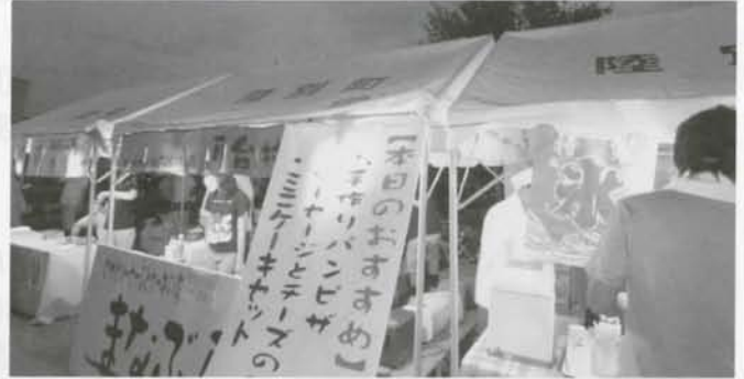
(財) 自治総合センターのコミュニティ助成事業により、イベント用テントが10張購入されました。各イベント時に利用され宝くじの広報PRに役立たせます。