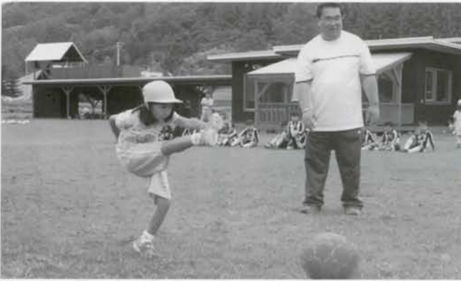
保育所でサッカー少年団によるサッカー教室が開かれました