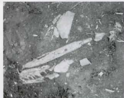
写真④ 中柄の出土状況