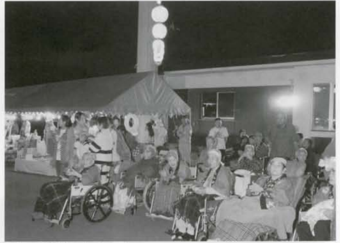
しらかば苑でふれあい盆おどりが開催されました