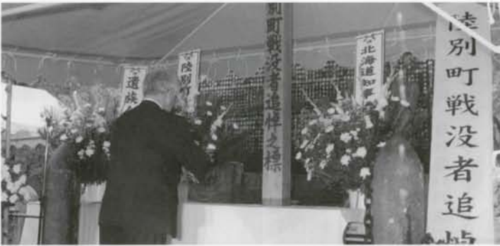
陸別町戦没者追悼式が行われました。