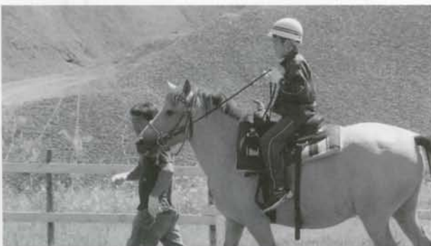
馬産振興会青年部が小学校の地域授業として、乗馬などを体験する教室を開きました。