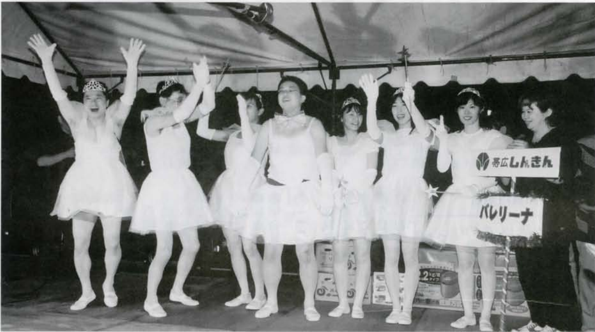
◀ 団体の部 優勝の しんきん チーム