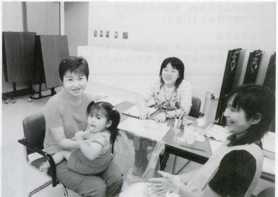
歯の健康の為に乳幼児にフッ化塗布が行なわれました。