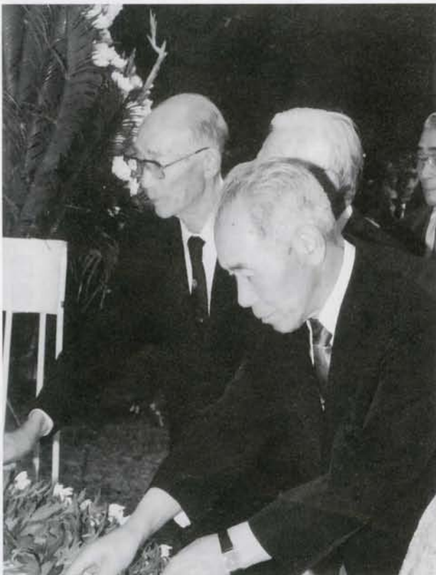
▲陸別町戦没者追悼式が行なわれました。