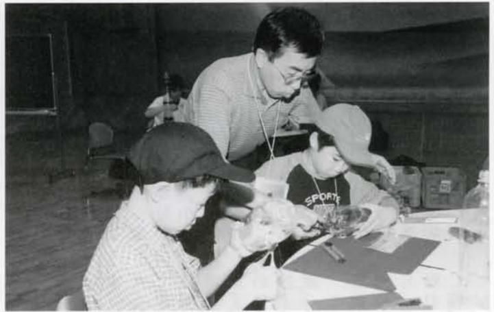
▲スペースキャンプ2003が行なわれ陸別ではペットボトルによるロケット作り、講演会、天体観測などのメニューを体験しました。