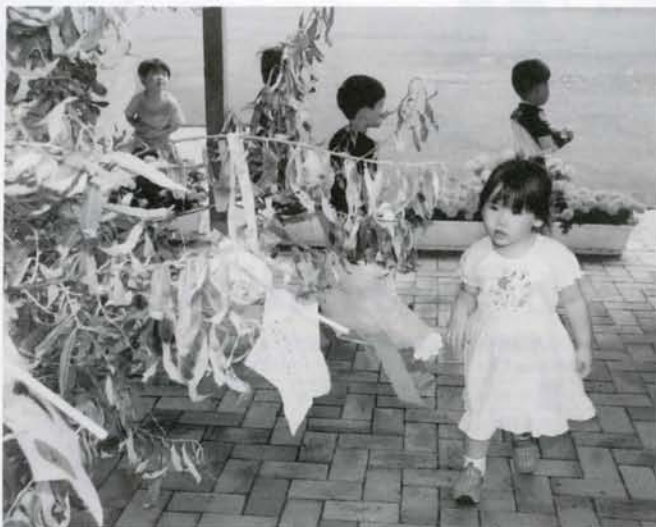
▲8月7日保育所で七夕祭りが行なわれました。