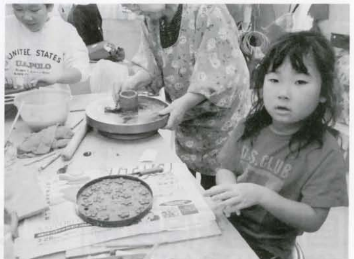
▲夏休みの体験授業ということで子供陶芸教室が開かれました。