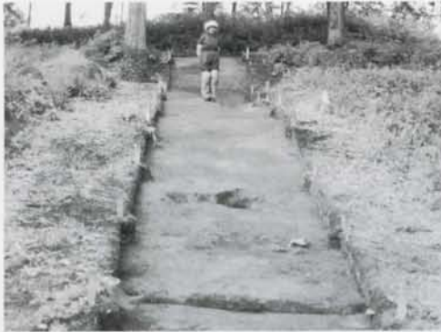
写真②盛土上面の様子 (B郭)

いました。今回の調査ではC郭の外側にも盛土があることが初めて確認できました。これによってチャシの周りは全て盛土で囲まれていることが分かったのです。