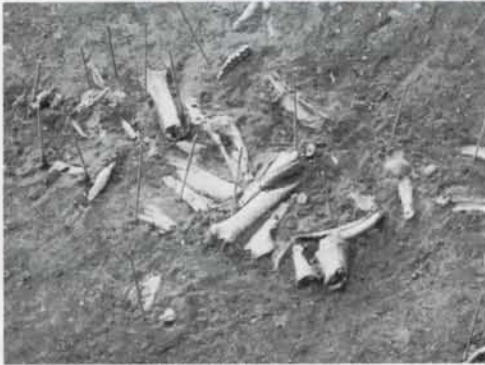
写真①シカ骨出土状況

これまでの調査で、A・B・Cと三つある郭のうちA郭とB郭の外側に盛土があることが分かって