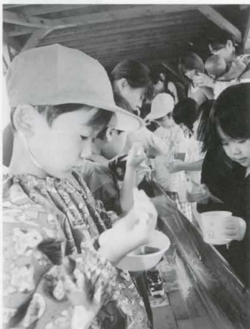
▲保育所で親子レクリエーションが行なわれ、流しそうめんを楽しみました。