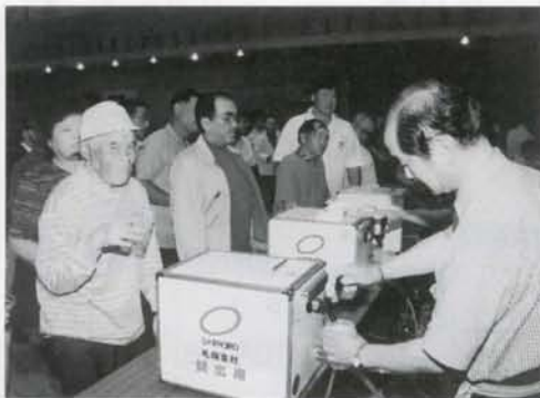
▲ふれあいビールまつりが行なわれ約600人が参加、ビール20lの樽21個が消費されました。