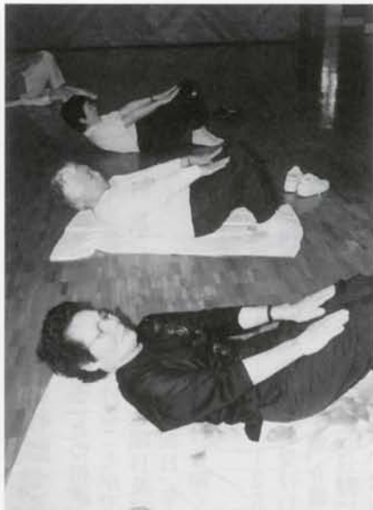
▲転倒予防教室が行なわれました。