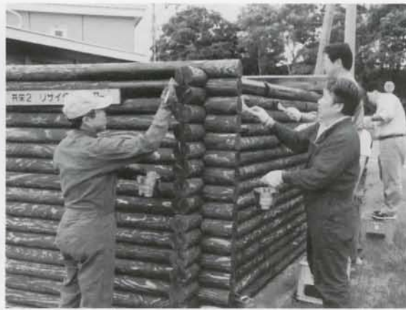
▲石橋建設グループみつわ会によるボランティアでリサイクルセンターの塗り替えが行なわれました。