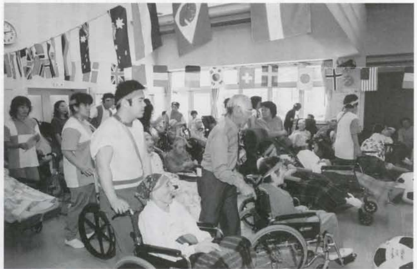
▲しらかば苑でふれあいレクリエーションが行なわれました。