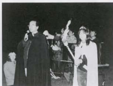
▲キャンプファイヤー