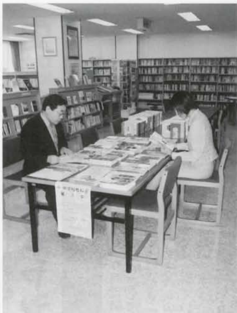
▲小中学校教科書（平成15年度）の展示会が行なわれました。