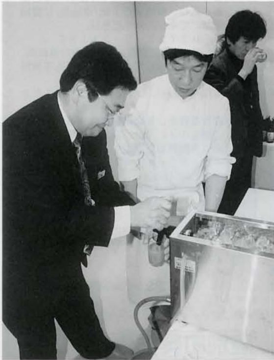
陸別産のニンジンを使った発砲酒の試作品の試飲会が商工会館で行なわれました。今後の改良と製品化が期待されます。