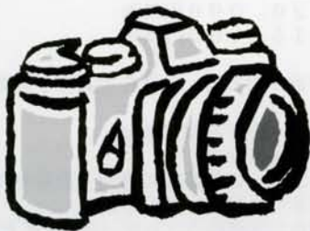
1月12日平成15年成人式が行なわれました。