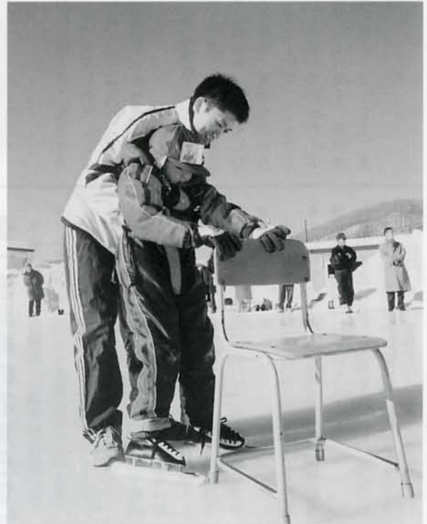
5才児スケート教室が行なわれました。イスにつかまりながら歩く練習です。