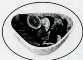
三角コーナー約1杯分(約700g)の生ごみ