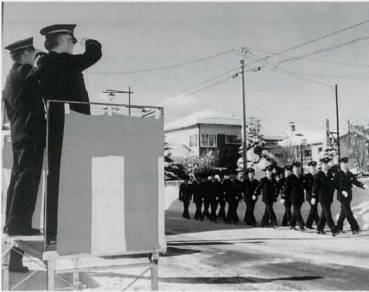
1月6日消防新年出初め式が行われました。