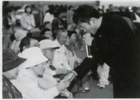
シューティング鈴木ショー