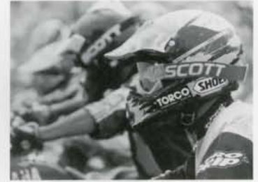
白熱した オフロードレース