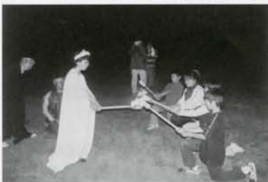
キャンプファイアー