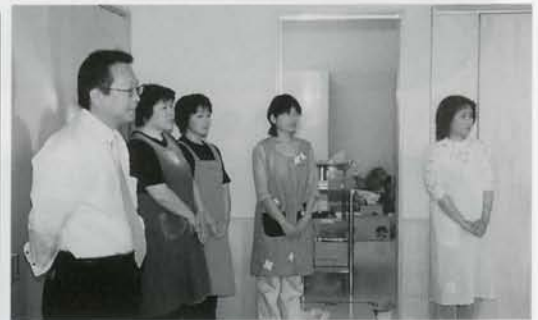
りくべつエヌピーオー優愛館のみなさん