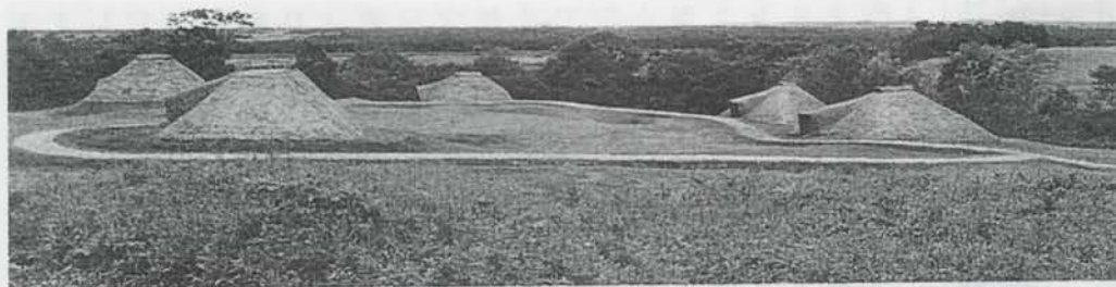
史跡整備例：復元された擦文時代の住居(釧路市・史跡北斗遺跡)

の指導助言と協力を得て平成11・12年度に整備のためのチャシの基礎データを収集する目的で試掘調査が行われたのです。 現在、チャシの整備は基本計画が策定され、この計画に従ってより具体的な設計段階に入っています。