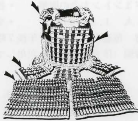
図1 出土した小札（上）と鎧の一例