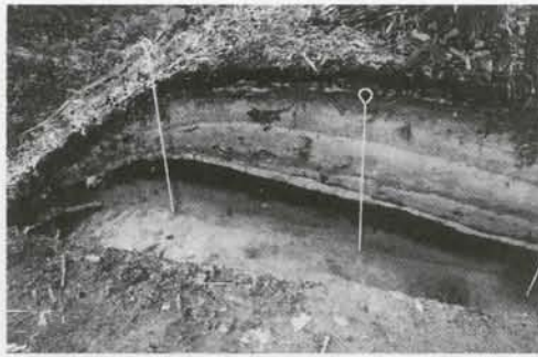
史跡ユクエピラチャシ跡の盛土

先月号では、ユクエピラチャシ跡の大きさや形について書きました。このチャシは3つの壕（堀のこと）で区切られた3つの郭（壕で囲まれたチャシの内部）で構成されています。この3つの郭を合わせたチャシの大きさは、南北方向で約110m、東西方向で約40mという大規模なものです。しかも利別川に面するチャシの東側は半分近くが崩落しているため、本来は現状よりもさらに大きいチャシであったと言えます。平成11・12年度に行われたチャシの試掘調査の結果、このチャシがさらに大規模なものであることが判りました。