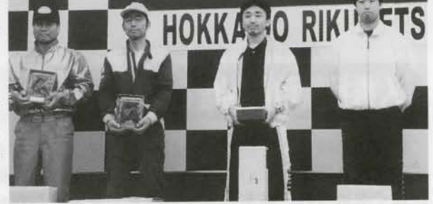
フォーミュラバギー B-II