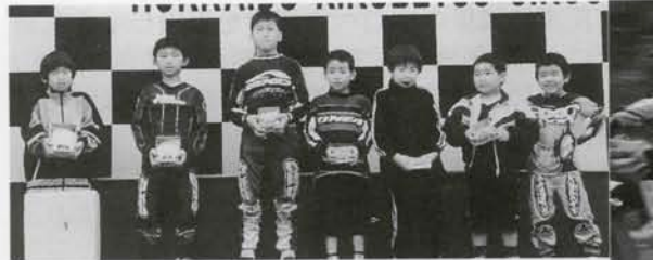
ATV 4W 100 Kids