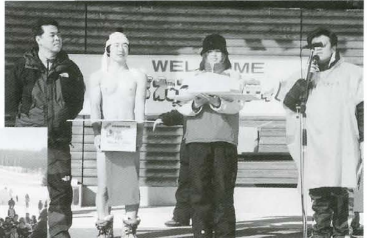
▲今年のしばれチャンピオンは白糖町の女性 (写真右から2番目)