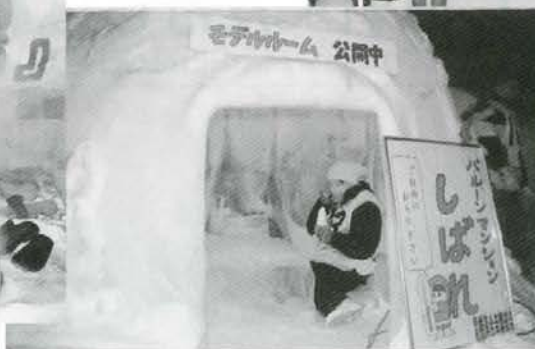
◀寒い時にはやっぱりソフトクリーム？