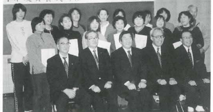
訪問介護員養成研修 2級課程 修了式

10月11日から始まったこの養成研修では、13日間の講習、3日間の実習を経た17名が終了証を手に入れました。