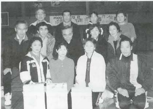
ミニバレー混成男子40歳以上