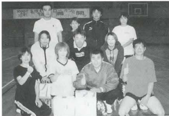
ミニバレー混成男子40歳未満