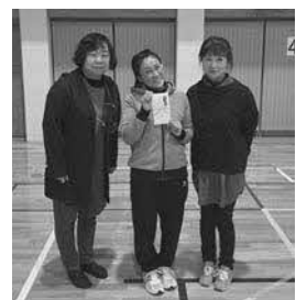
Eブロック優勝 新町2区