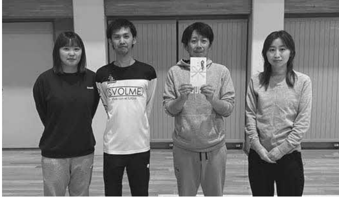
40歳未満の部 <4チーム参加> 優勝 共栄第1B