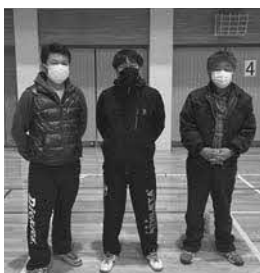
Aブロック優勝 若葉2