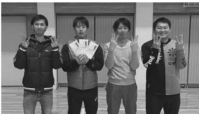
Aブロック優勝 共栄第1C