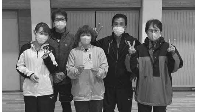
40歳以上の部 <3チーム参加> 優勝 共栄第1A