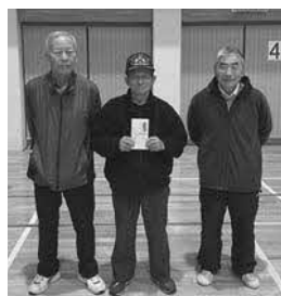
Cブロック優勝 新町1区A