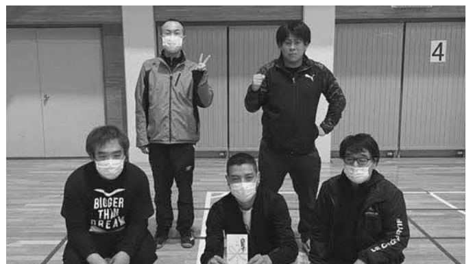
Bブロック優勝 東1条2区