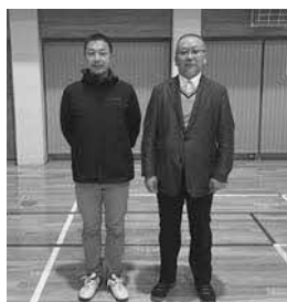
Bブロック優勝 共栄第1A