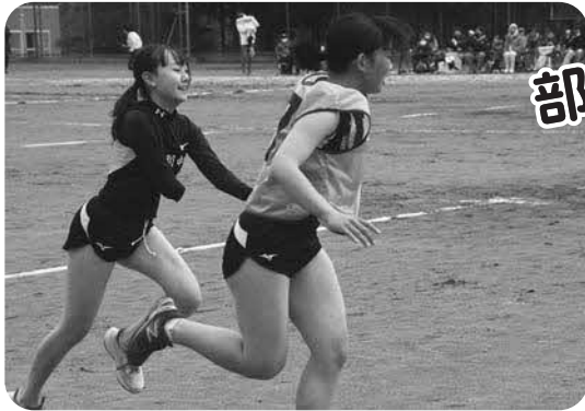
部活動混合リレー

新型コロナウイルス感染症の影響で、昨年に引き続きプログラムが縮小され午前からの開催となり、当日は肌寒い気温と時折強風が吹くあいにくのコンディションでしたが、生徒たちの全力で取り組む姿に来場者から大きな拍手が送られました。