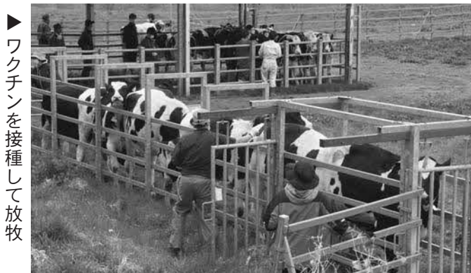
▶ ワクチンを接種して放牧