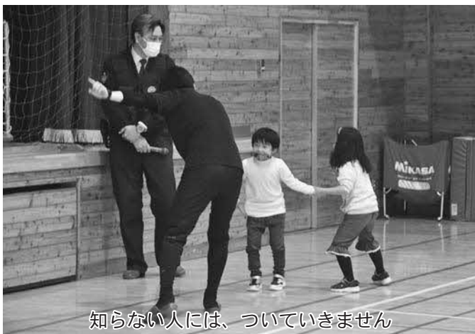
知らない人には、ついていきません