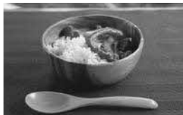
※野菜は缶詰に入っていない

詳細 野生肉専門店「やせいのおにくや」 メール wild.butcher2020@gmail.com HP https://yaseionikuya.theshop.jp/