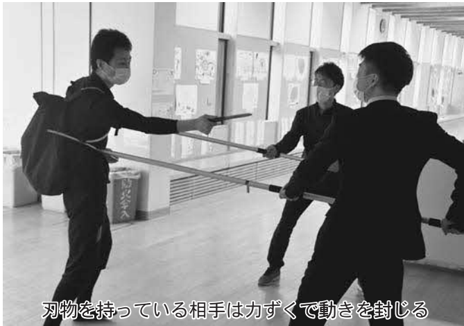
刃物を持っている相手は力づくで動きを封じる

5月10日、不審者が児童玄関から侵入した想定で訓練が実施され、児童の安全確保や避難方法など関係者が不審者対応について学びました。