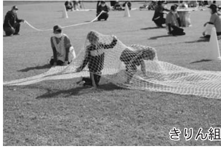
きりん組チャレンジ