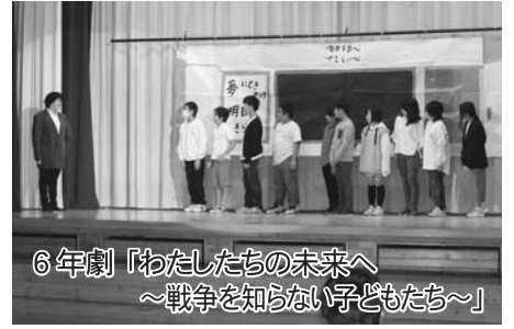
6年劇「わたしたちの未来へ ～戦争を知らない子どもたち～」