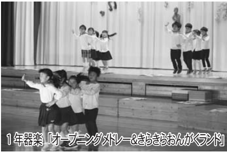
1年器楽「オープングロー&ささおんがらん判