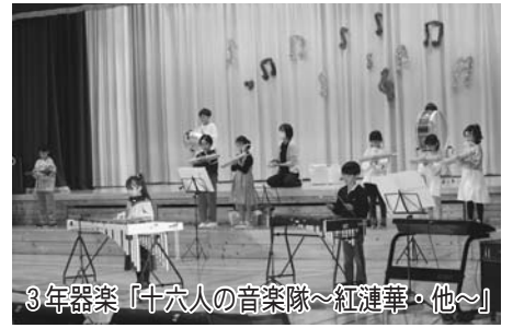
3年器楽「十六人の音楽隊～紅蓮華・他～」