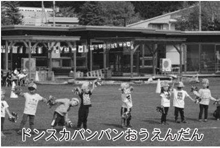
ダンスカパンパンおうえんだん