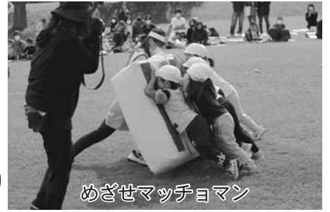
めざせマッチョマン