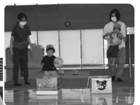
▲アンパンマンをはこぼう