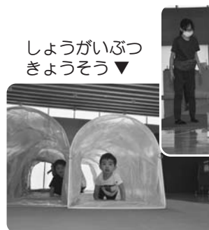
しょうがいぶつ きょうそう ▼