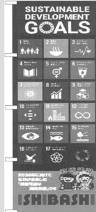
石橋建設社長のデザイン