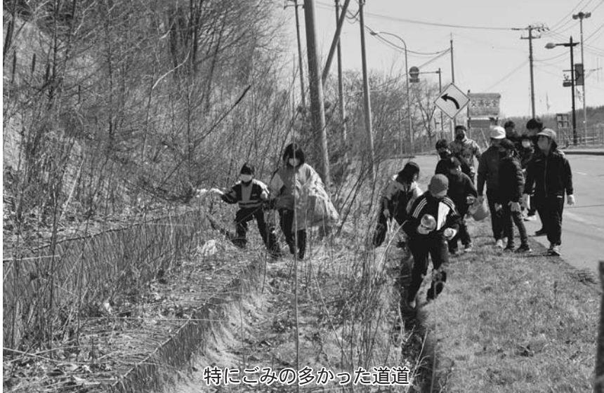
特にごみの多かった道道

4月27日、陸別小学校（4・5年生36人）陸別中学校（1～3年生48人）の児童・生徒84人が、学年混合の8グループに分かれ、ごみ拾いのボランティア活動を行いました。