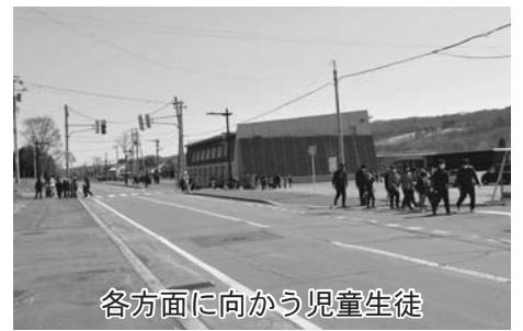
各方面に向かう児童生徒