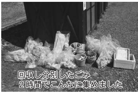
回収し分別したごみ 2時間でこんなに集めました