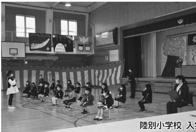
陸別小学校 入学式（4月8日）

4月7日に陸別保育所で入所式、4月8日に陸別小学校・陸別中学校で入学式が行われ、保育所18名（ひよこ組10名、うさぎ組7名）、小学校16名、中学校19名の新入生が、保護者の見守る中、たくさんの夢と希望を胸に門をくぐりました。