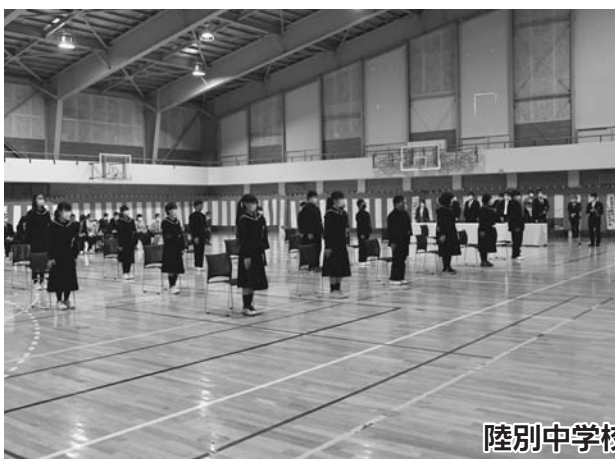
陸別中学校 入学式（4月8日）