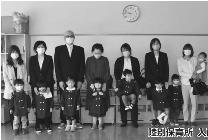
陸別保育所 入所式（4月7日）