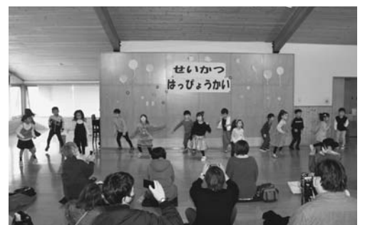
5歳 アリババと4人の盗賊他