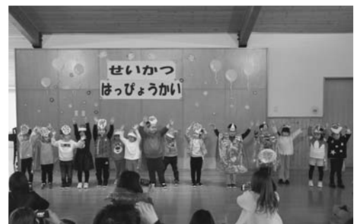
4歳 ぞうぐみ♪ショータイム