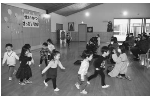
3歳 うたあそび「おおかみさん」他