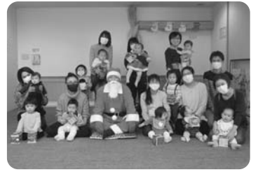
12/21・23・25 子育て支援センターでクリスマス会が新型コロナウイルス感染症拡大防止対策を行い、年齢ごとに分散形式で開催されました。