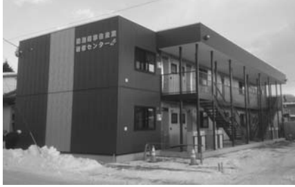
移住産業研修センター

3月18日、委員会合同で、消防広域化に伴う、新しい救急通報システムの視察を行いました。