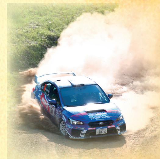
陸別町は、かつてWRC(世界ラリー選手権)ラリージャパンの 会場になるなどモータースポーツも盛ん。 (写真は2018年のラリー北海道)