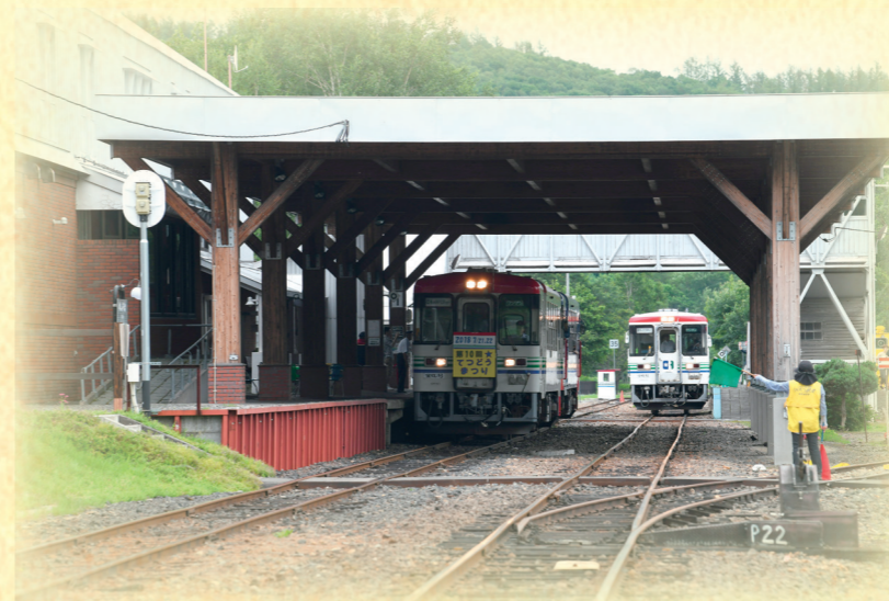
ふるさと銀河線りくべつ鉄道では、実際に運行していたディーゼル気動車の運転体験ができる。 町民の力によって運営され、全国からファンが訪れている。