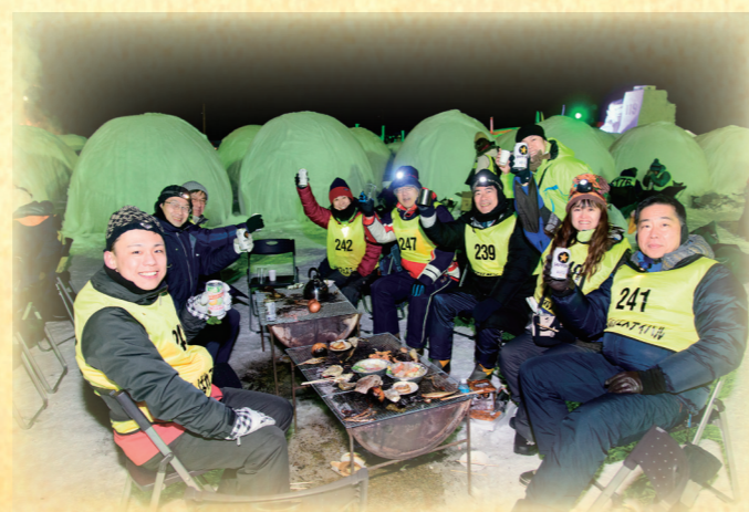
しばれフェスティバルでは、極寒も楽しみの一つとなる。仲間で盛り上がり、 氷のかまくら「バルーンマンション」(写真後方)で一晩過ごす。