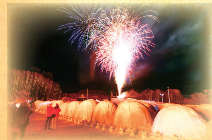
空気が澄んでいる冬は、花火が鮮やかに見える。しばれフェスティバルでは、 花火に見とれ寒さを忘れてしまう時間だ。