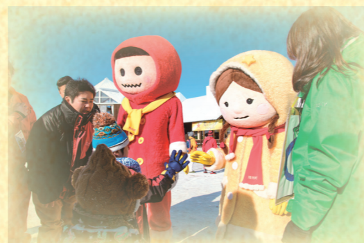
陸別町のキャラクター、しばれ君(左)とつららちゃん(右)は、 しばれフェスティバルの会場で人気を集める。