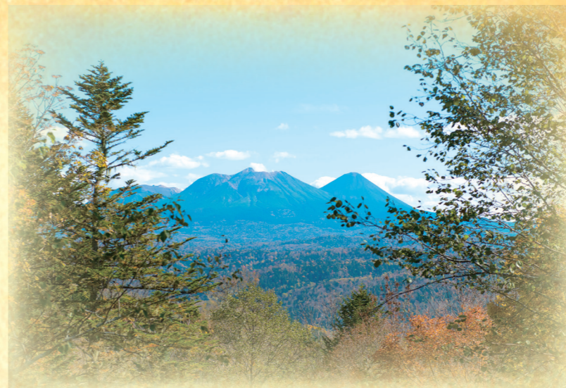
カネラン峠から望む雌阿寒岳(中央)と阿寒富士(右)。陸別町と足寄町上足寄の間にある峠。 カーブが続き、途中は砂利道となるので注意して運転を。