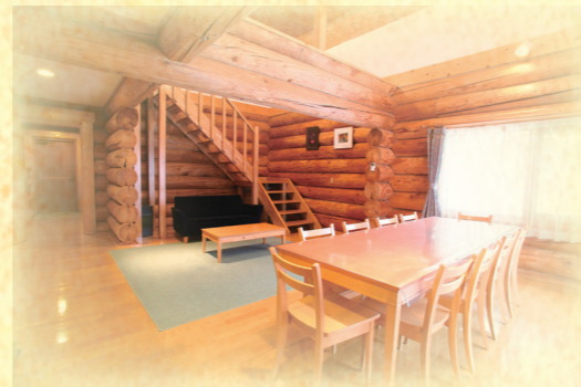
銀河の森天文台近くには「銀河の森コテージ村」がある。 星を観察して、コテージに泊まる。癒やしの時を過ごせる。