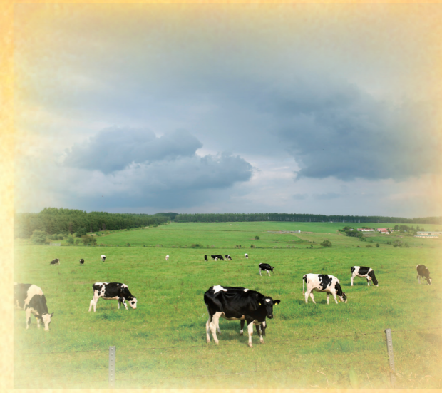
酪農の町でもある陸別町。森林も多いが、 広大な牧草地でゆったりと牛たちが草をはむ。