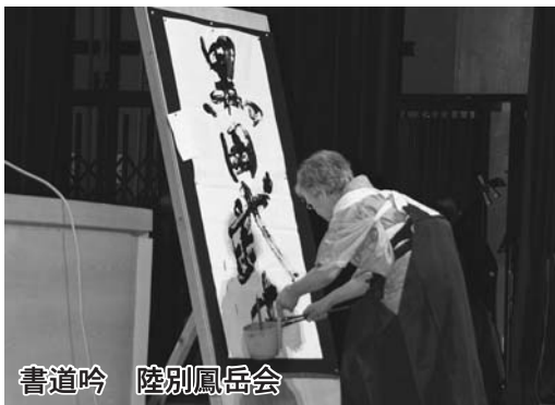
書道吟 陸別鳳岳会