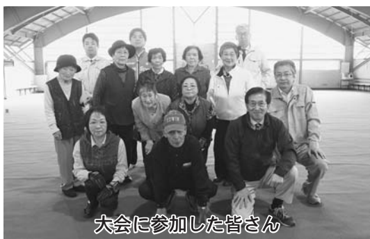
大会に参加した皆さん

大会には、3チームが出場。試合は、石谷チームと飯尾チームが同点で優勝を分け合いました。順位は次のとおり。 優勝 石谷チーム 飯尾チーム 第3位 役場チーム