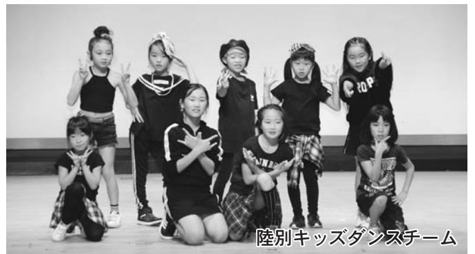
陸別キッズダンスチーム