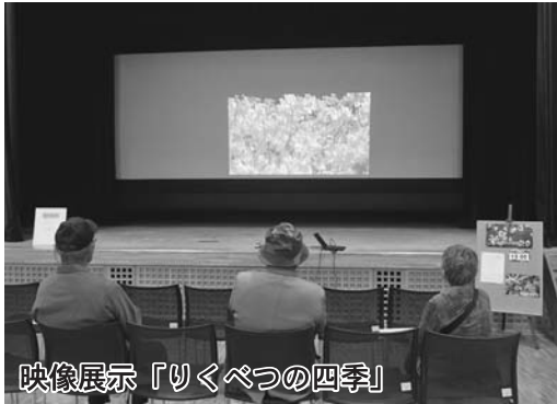
映像展示「りくべつの四季」