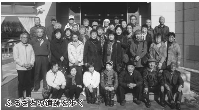
ふるさとの遺跡を歩く