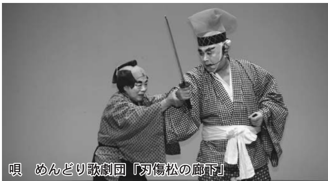
唄 めんどり歌劇団「羽傷松の廊下」