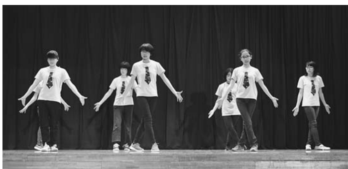
ボランティア部発表