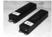
業務用照明器具の安定器