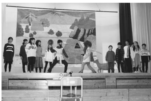
6年 劇「タピオカ・ツンドラ」