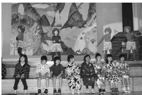
2年 劇「ないた赤おに」