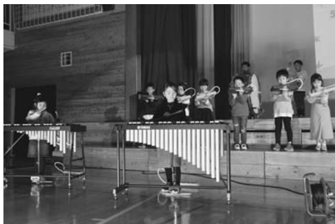
1年 歌・器楽「おながくランド」