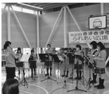
陸別リコーダーアンサンブルクラブ