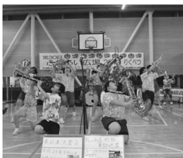
池田高校吹奏楽部「ダンプレス」ステージ