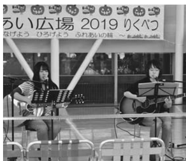
いくあゆギターデュオ