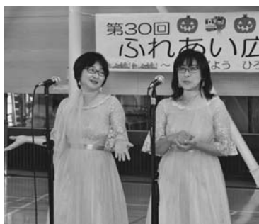
ゆみちやんたかちゃんの笑費者漫才

10月5日 ふれあい広場2019りくべつ（同実行委員会主催）が保健センター内で行われました。昨年に引き続き、ギターデュオ「いくあゆ」がオープニングを飾り、保育所園児のよさこいソーランの演舞、陸別リコーダーアンサンブルクラブの演奏と、ゆみちやんたかちゃんの笑費者漫才、池田高校吹奏楽部の「ダンプレス」ステージショーなどが会場を盛り上げました。参加団体の出店も建ち並び、訪れた約400人の来場者は秋の一日を楽しみました。