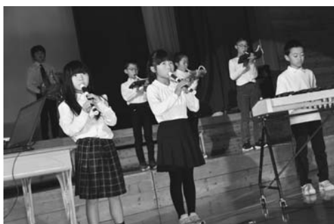
3年 歌・器楽「優しいあの子・他」