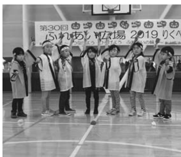
保育所園児のよさこいソーラン演舞