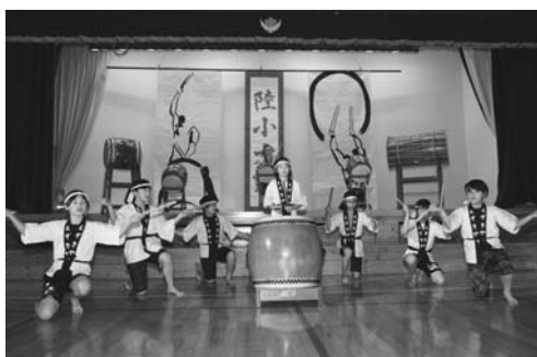
5年 和太鼓「陸小太鼓2019」