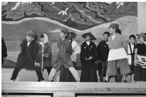
4年 劇「三年山のあまのじゃく」

成果を発表しました。6年生は、劇「タピオカ・ツンドラ」を披露。児童の熱演に会場からは大きな拍手が送られました。