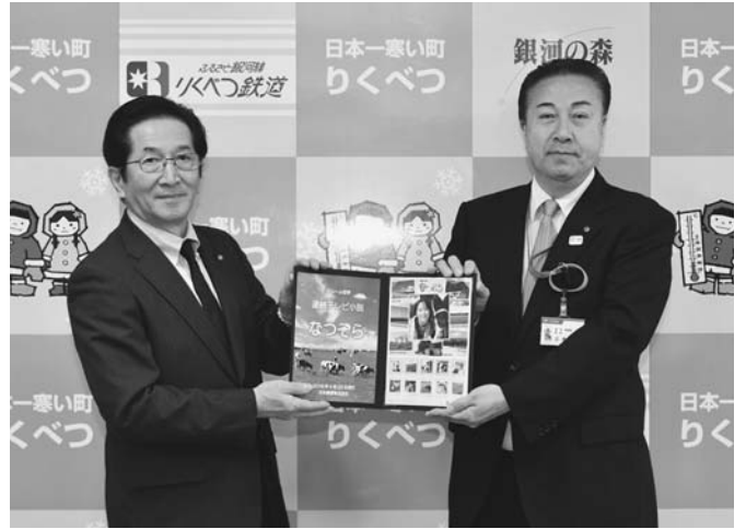
4/22 日本郵便株式会社北海道支社がNHK連続テレビ小説「なつぞら」のオリジナルフレーム切手の限定販売を北海道内で開始し、十勝地方での撮影に協力した各市町村で、贈呈式が開催されました。