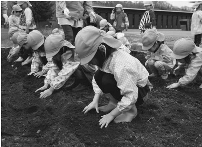
5/10 晴天の中、陸別保育所で畑の土おこしと芋植えが行われました。こどもたちは芋の成長を願いながら植えました。