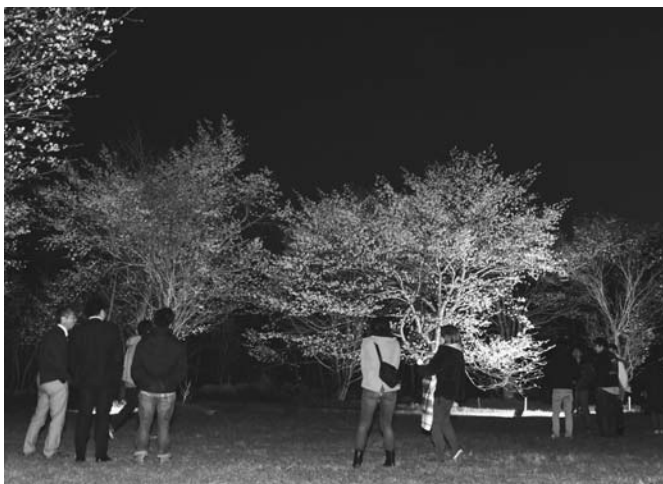
5/12 上斗満地区のエゾヤマザクラが満開になり、待ちわびた町民らが、町内では貴重な桜を楽しみました。この日は観光協会によるライトアップも行われ、家族連れなどが夜桜見物に訪れました。