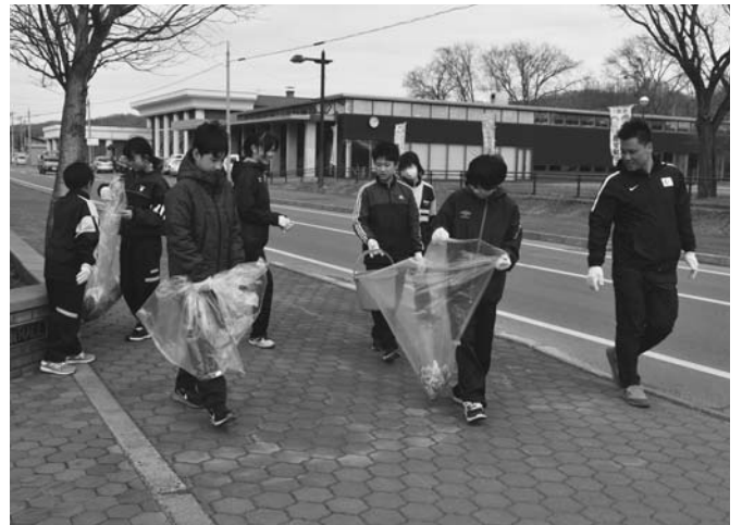
4/23 陸別中学校の1年生が野外奉仕活動で町内の清掃活動を実施しました。生徒達は雪解けから出てきたゴミ等を、一生懸命に拾いました。