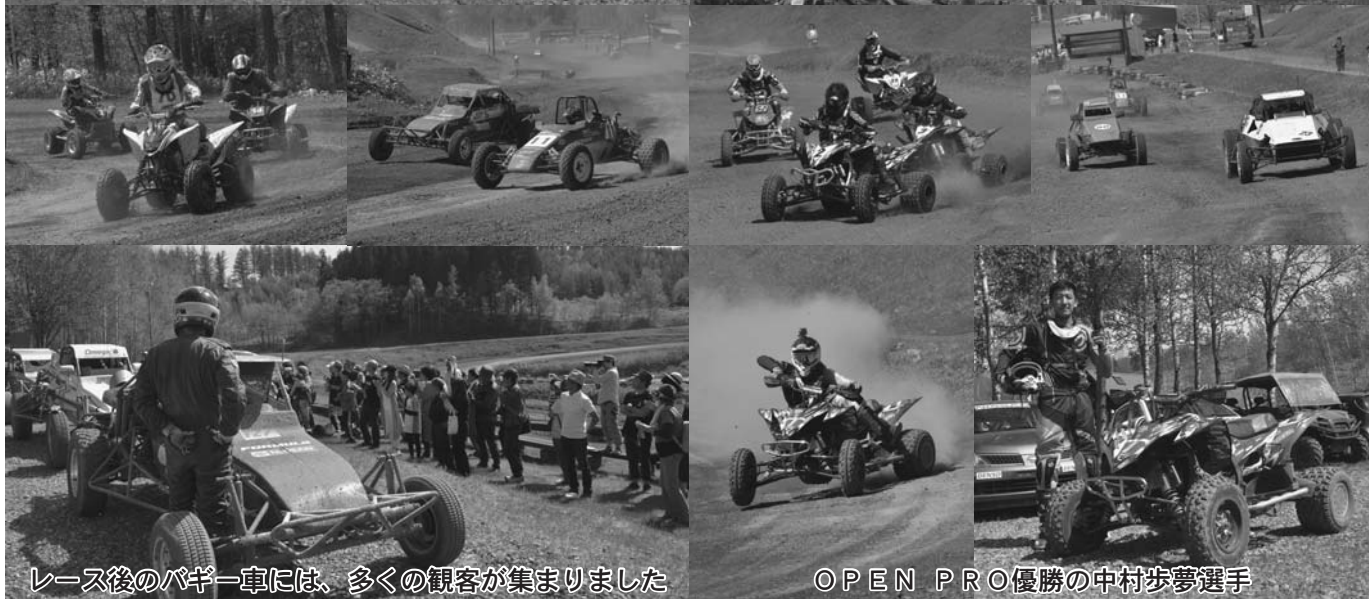
レース後のバギー車には、多くの観客が集まりました

北海道バギーレース協会シリーズ 第1戦 北海道ATVチャンピオンシップレース 第4戦