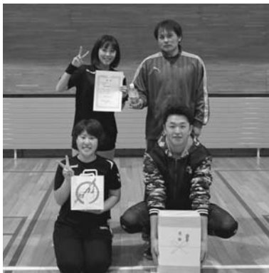
160歳未満の部で優勝した「ARCANUM」