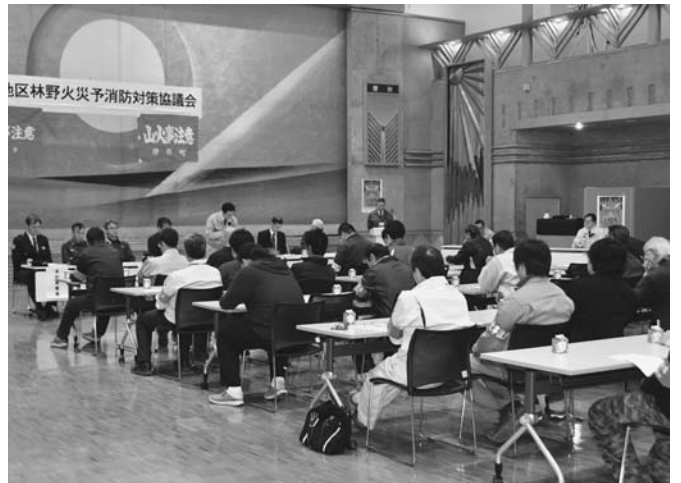
4/4 平成31年度陸別地区林野火災予防対策協議会がタウンホールで開かれ、38人が出席しました。同協議会は関係機関や企業が連携し、林野火災の対策を協議する場として毎年開催されています。