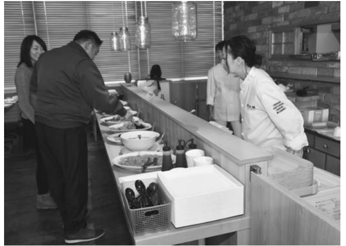
4/1 コミュニティプラザ☆ばらっと内のばらっと広場で中国広東料理の「美珍楼」(帯広市)がワンディシェフに初出店しました。形式はバイキングとテイクアウトバイキングで、11時の開店時には続々と来客者で賑わいました。