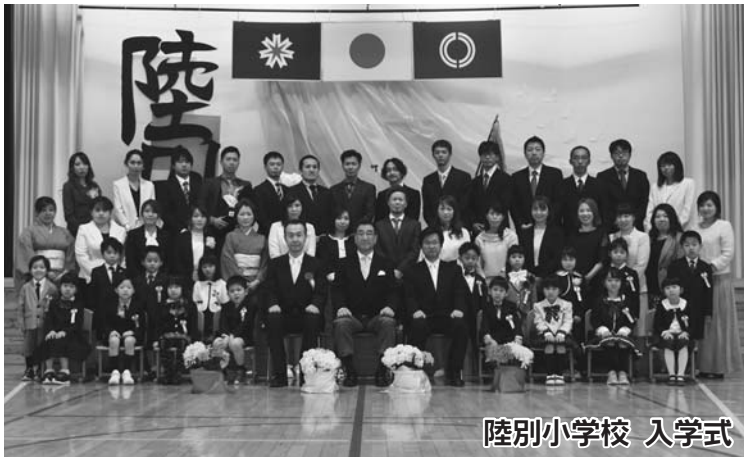
陸別小学校 入学式（4月8日）