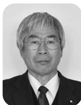
谷 郁司 (5期目)

北海道知事選挙 4月7日 統一地方選挙の前半戦となる北海道知事選挙が行われました。陸別町における得票数等は次のとおりです。