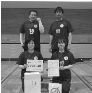
160歳以上の部で優勝した「レッツゴー4匹」