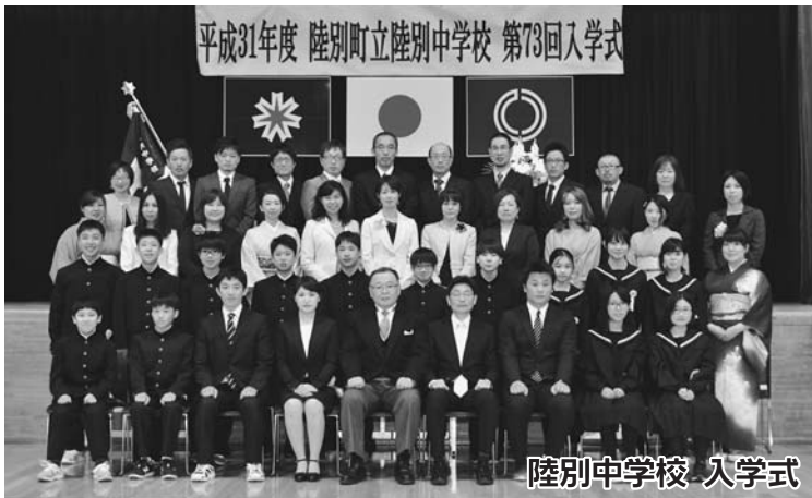
陸別中学校 入学式（4月8日）