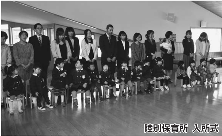
陸別保育所 入所式（4月5日）