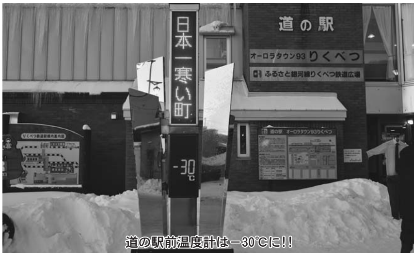
道の駅前温度計は-30℃に!!