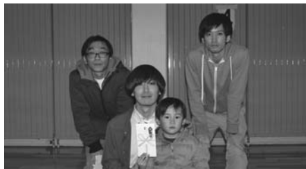
Aブロック 優勝 若葉 4