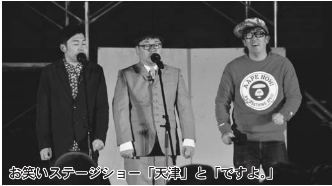
お笑いステージショー「天津」と「ですよ。」