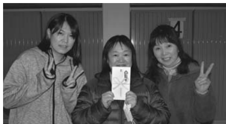
Bブロック 優勝 新町 2 区