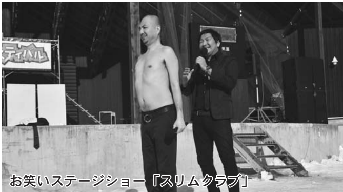
お笑いステージショー『スリムクラブ』