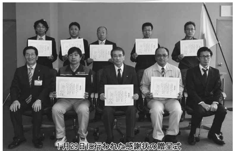
1月29日に行われた感謝状の贈呈式