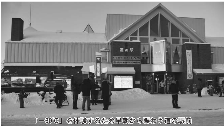
「-30℃」を体験するため早朝から賑わう道の駅前

2月9日 十勝地方は強力な寒波が流れ込み、晴れて地表の熱が奪われる放射冷却現象の影響で「平成最強の寒波」の名のとおり極寒の冷え込みとなり、陸別町では氷点下31・8度を記録し、今シーズンの全国最低気温を記録