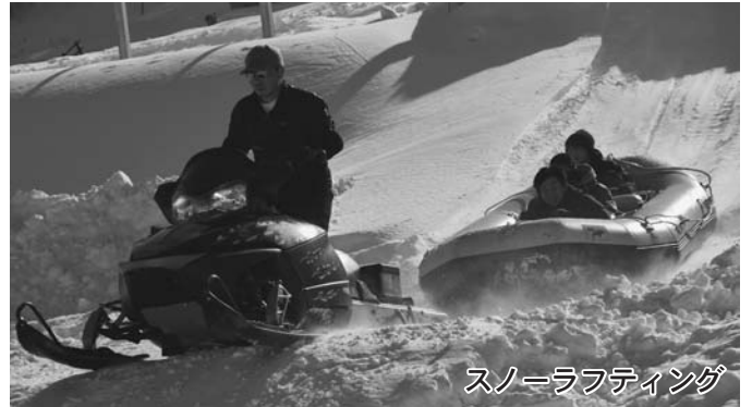
スノーラフティング