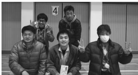
Bブロック 優勝 若葉 C