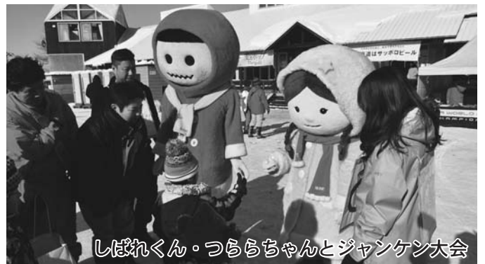
しばれくん・つららちゃんとジャンケン大会