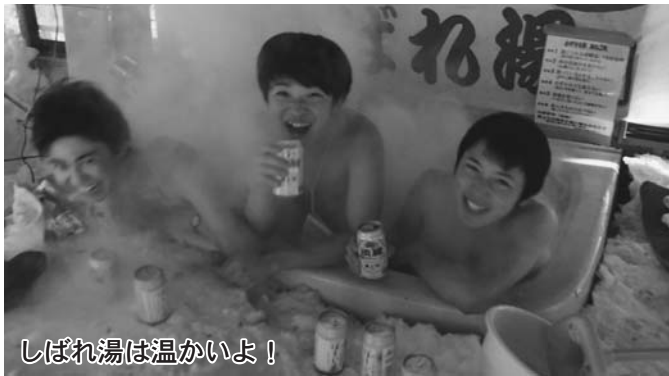
しばれ湯は温かいよ！