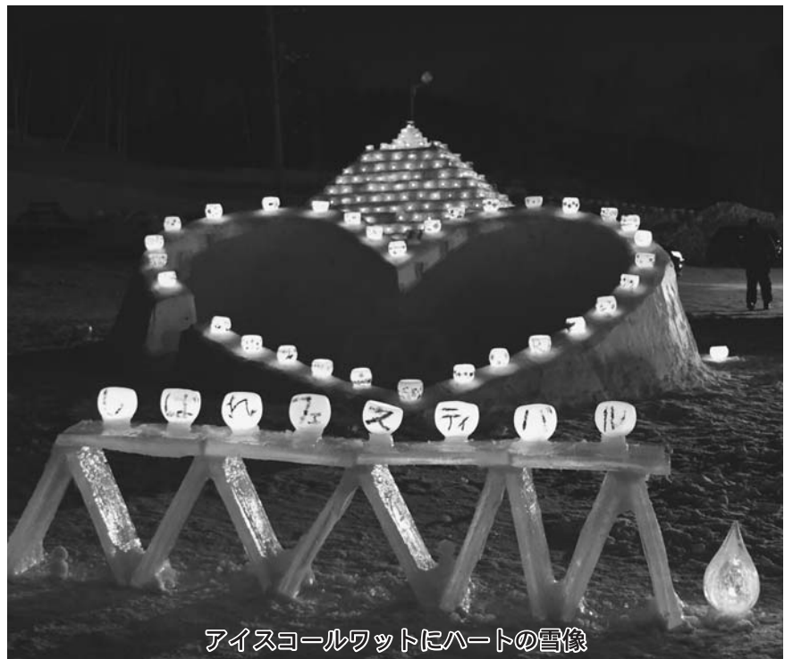
アイスコールワットにハートの雪像