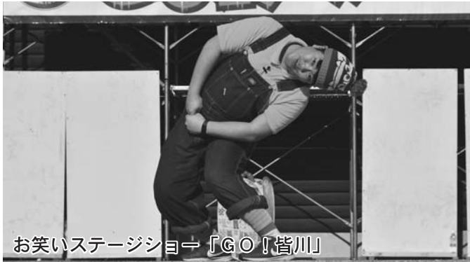
お笑いステージショー『GO!皆川』