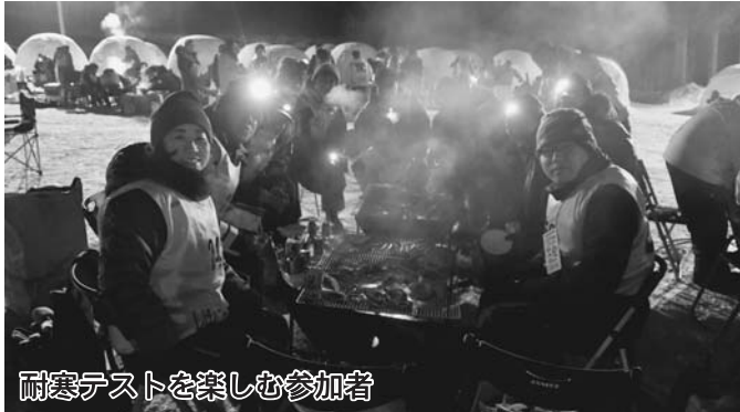
耐寒テストを楽しむ参加者