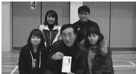
Aブロック 優勝 下陸別 B