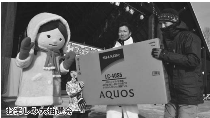
お楽しみ大抽選会