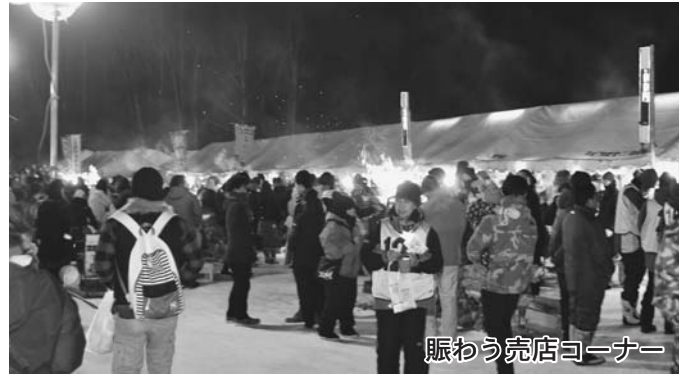
賑わう売店コーナー