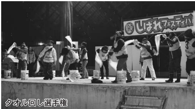
タオル回し選手権