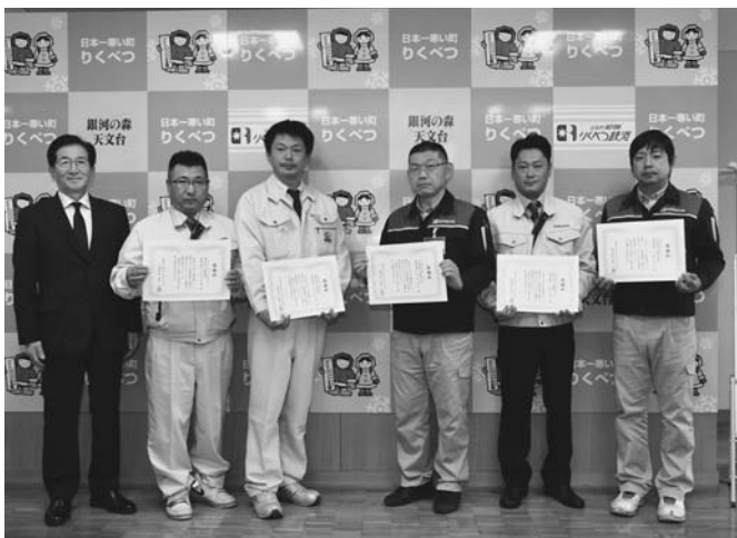
11/26 地域貢献活動の一環として、りくべつ鉄道のトロッ コ軌道上にトンネルを整備していただいた、(株)石 橋建設2名・(株)平田建設1名・(株)宮坂建設工業2 名の現場代理人に対して、町から感謝状が贈呈されました。