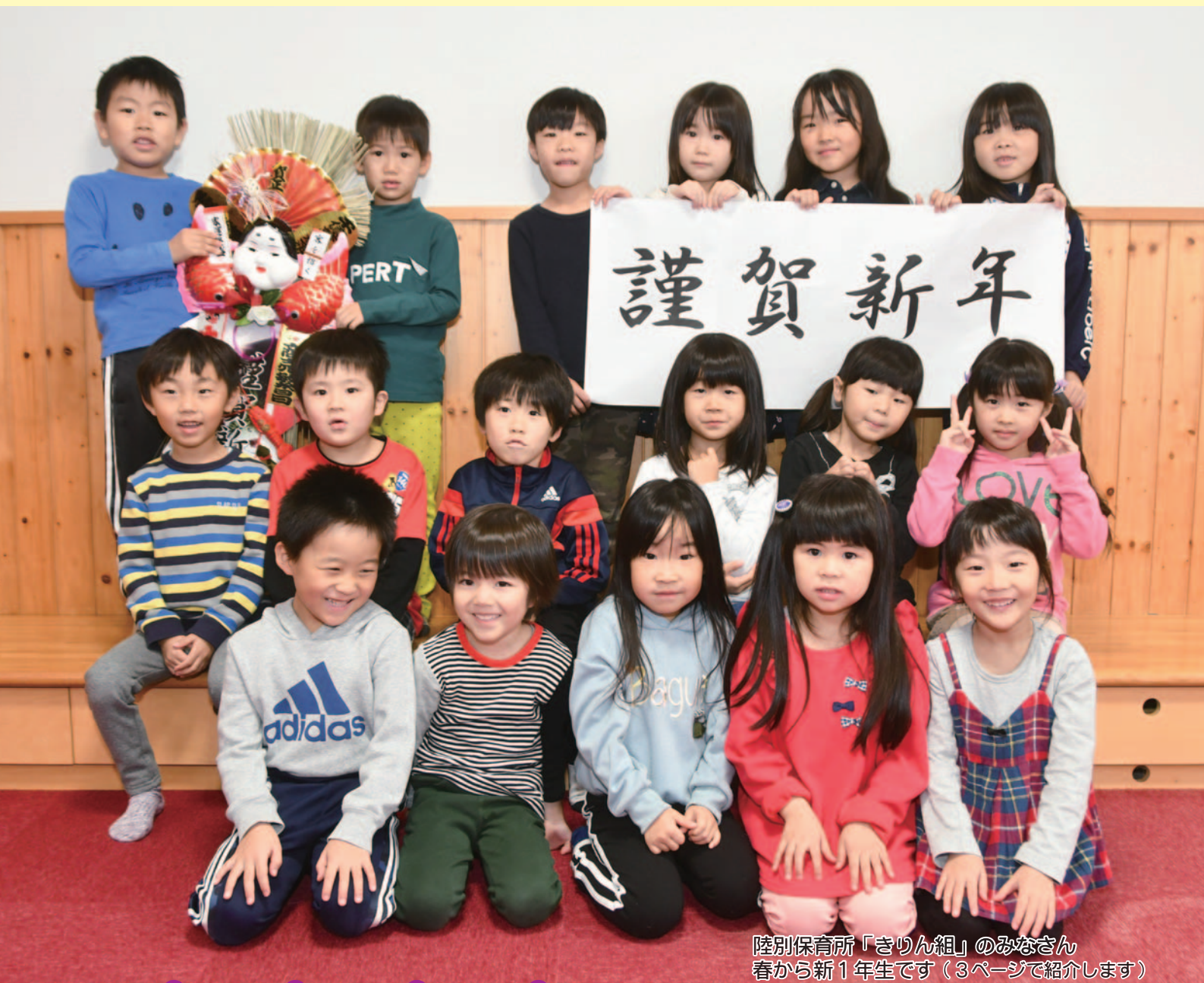
陸別保育所「きりん組」のみなさん 春から新1年生です（3ページで紹介します）