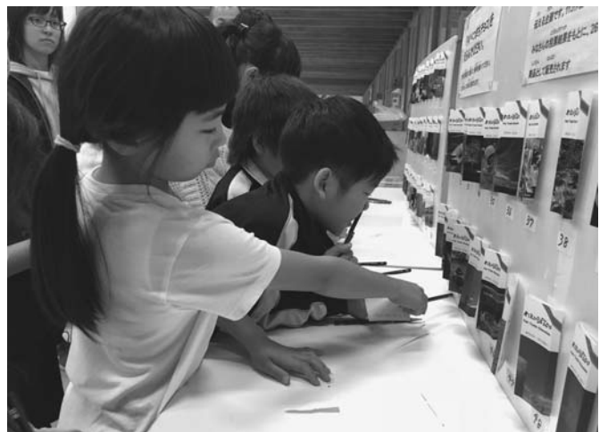
11/21 今年度のまちチョコに採用する写真選考として、 陸別小学校で投票が行われました。1人5作品を 選び、結果をもとに22作品がパッケージ化されま す。生徒たちは真剣な表情で写真を選んでいました。