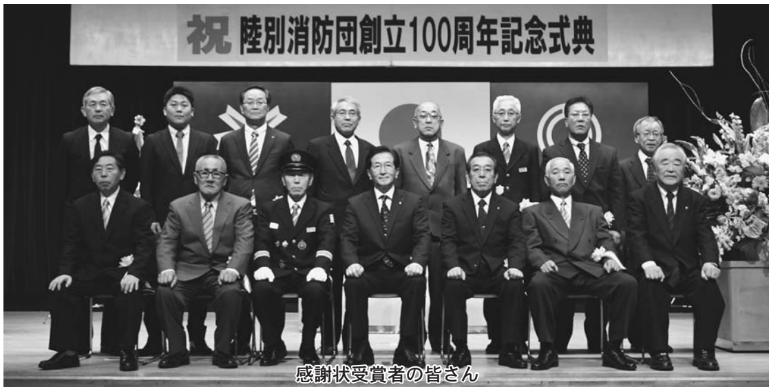
感謝状受賞者の皆さん