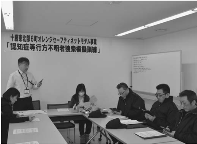
11/22 スマートフォン（スマホ）でアプリを活用し行方不明者を探 す「認知症等行方不明者検索模擬訓練」が東北部6町で実施 され、陸別町でも行われました。対象者の写真や特徴などを スマホで確認し、グループに分かれて行方不明者を検索しました。