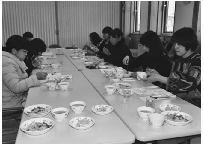
11/16 町がチャレンジプロジェクトとして行っている、薬用植物の栽培 研究事業の周知も兼ねた薬膳料理の試食会が、町農畜産物加工研 修センターで開催されました。この日は11人が参加し、試食の他に 蒸留して抽出した精油や芳香蒸留水としての活用などが紹介されました。