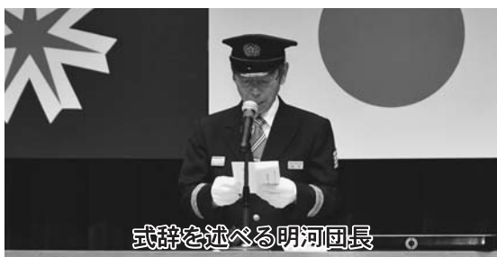
式辞を述べる明河団長

11月25日、陸別消防団創立100周年記念式典が町タウンホールで開催されました。