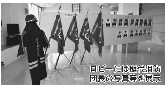
ロビーには歴代消防団長の写真等を展示