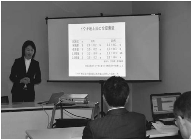
11/22 薬用植物研究事業講演会が役場第3会議室で開催されました。 「薬用植物の国内栽培を支援する技術の開発」と「名寄市薬用 作物研究会の取組について」をテーマに講師が説明。参加者は、 最新の栽培技術や生産組織の取組など、専門的な知識を学びました。