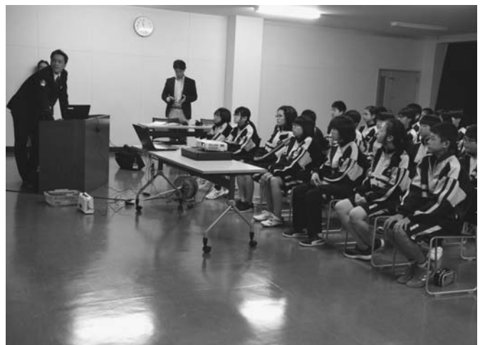
5/19 陸別中学校で土曜授業を行いました。本年度最初の授業は、本別警察署員の2人がインターネット絡みの犯罪やいじめなどについて講話。生徒は相手の姿が見えない、ネットの怖さなどを学びました。