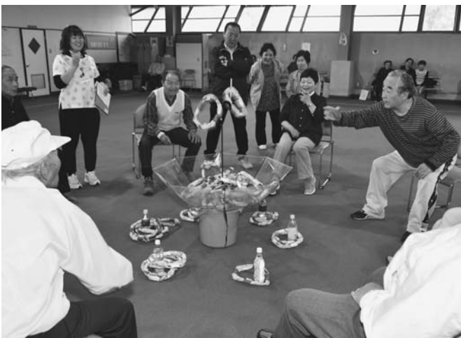
6/13 今回で11回目となる老人クラブ連合会軽スポーツ交流大会が旭町の屋内ゲートボール場で開催されました。4種目の競技を2チームに分けて競い合い、参加された30人は楽しみながら運動を満喫しました。