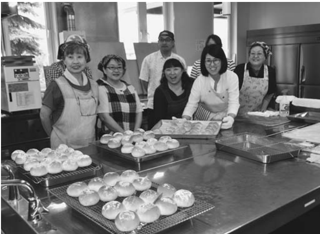
6/11 町社会福祉協議会が「ふれあいパン教室」を農畜産物加工研修センターで開催しました。参加者は、講師の説明を熱心に聞きながら、パン生地を手ごねしてオーブンで焼いたのち、美味しく焼き上がったパンをいただきました。