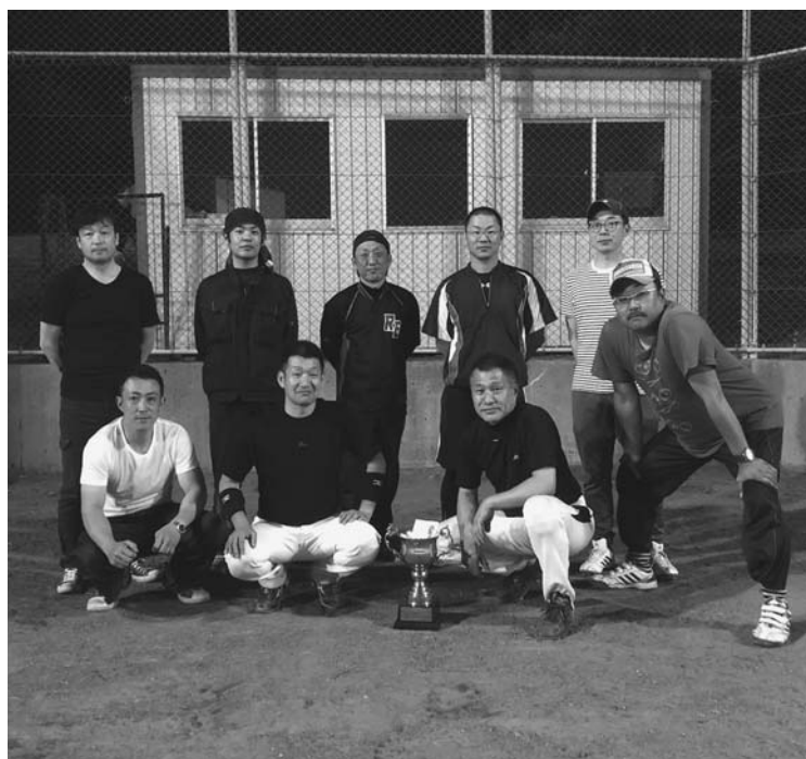
優勝した「REビューティーズ」の選手の皆さん