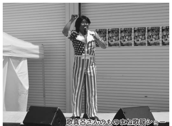
歌真呂さんのものまね歌謡ショー