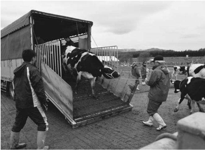
5/19・20 町内ポイントマムの畜産センターへの入牧が始まり、町内の酪農家から集まった1,145頭の牛が消毒や予防接種を受けて放牧されました。牛たちは広い牧草地で、のびのびとこの夏を過ごします。