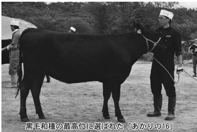
黒毛和種の最高位に選ばれた「あかりの16」

審査の結果、黒毛和種の部は、(有)赤川牧場の「あかりの16」、乳牛の部は、(有)編田牧場の「アミダ プリンセス ゴールド チップ ローザ」がそれぞれ最高位に輝きました。