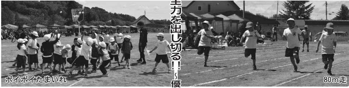
ポイポイたまいれ