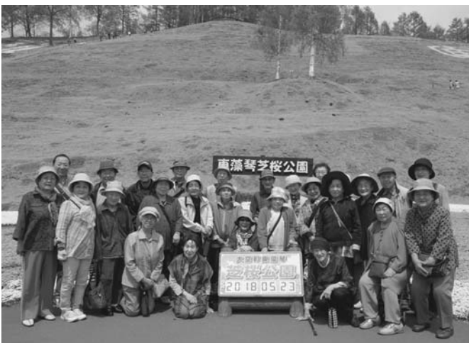
5/23 町社会福祉協議会の「ふれあい昼食交流会」が開催され、オホーツク管内大空町東藻琴の芝桜公園を見学しました。晴天にも恵まれ、参加者は一面満開のシバザクラを楽しみました。