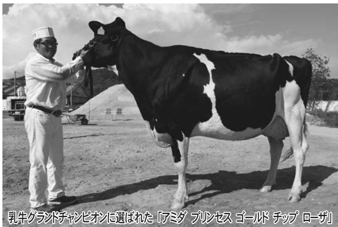
乳牛グランドチャンピオンに選ばれた「アミダ プリンセス ゴールド チップ ローザ」