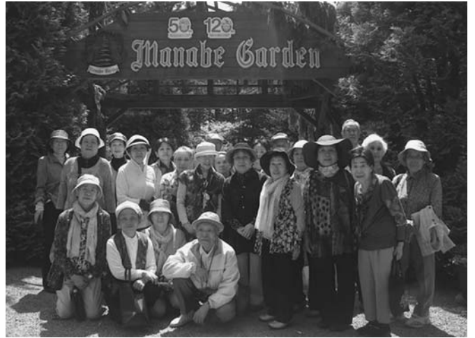
5/15 今年度の第2回くべつことぶき大学が開催されました。この日は町外研修で、帯広市の真鍋庭園と紫竹ガーデンを訪れ、参加者は施設内を歩きながら観賞を楽しみました。