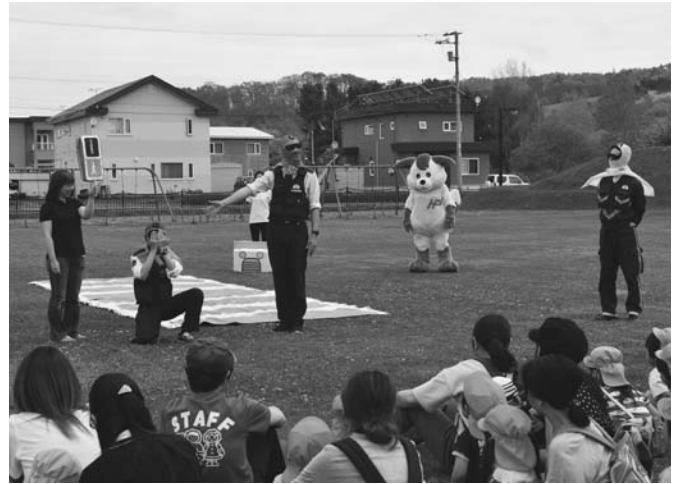
5/23 こぐまクラブによる交通安全教室が保育所で行われました。本別警察署員が協力し、この日のために信号機の赤青黄の「シバレンジャー」を結成。交通ルールについて寸劇を披露しました。また横断歩道を再現して、正しい横断歩道の渡り方や信号の見方を園児に説明しました。