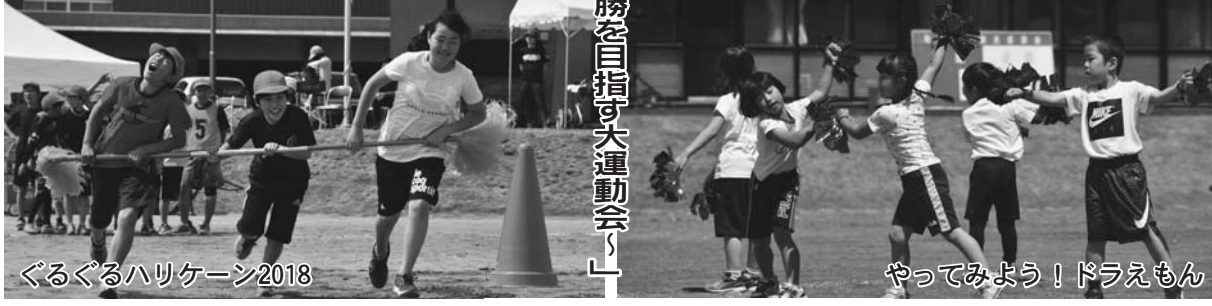
ぐるぐるハリケーン2018