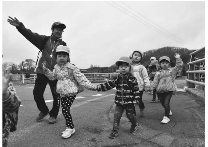
5/18 陸別保育所の遠足が行われました。園児は保育所を出発して、わかばスケート場に到着。おやつを食べた後、元気に遊びました。