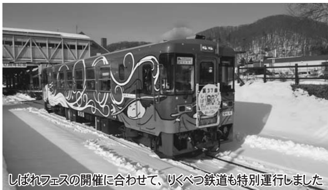
しばれフェスの開催に合わせて、リクベツ鉄道も特別運行しました