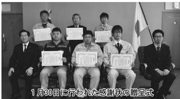
1月30日に行われた感謝状の贈呈式