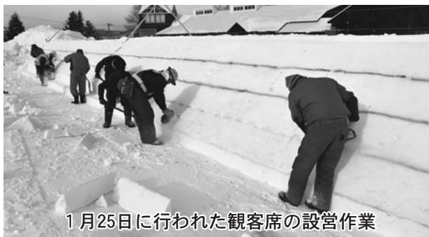
1月25日に行われた観客席の設営作業