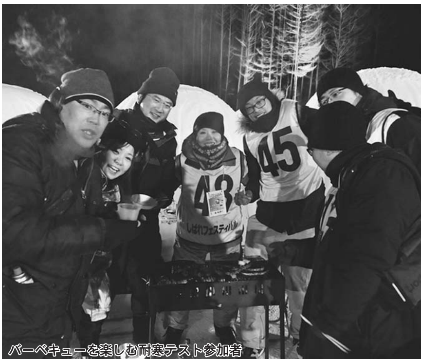
バーベキューを楽しむ耐寒テスト参加者

この日はスノーラリーにスノーラフティング、イベントの最後は恒例の大抽選会が行われ、大盛況のうちに閉幕しました。