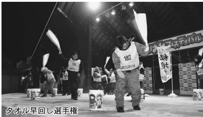
タオル早回し選手権