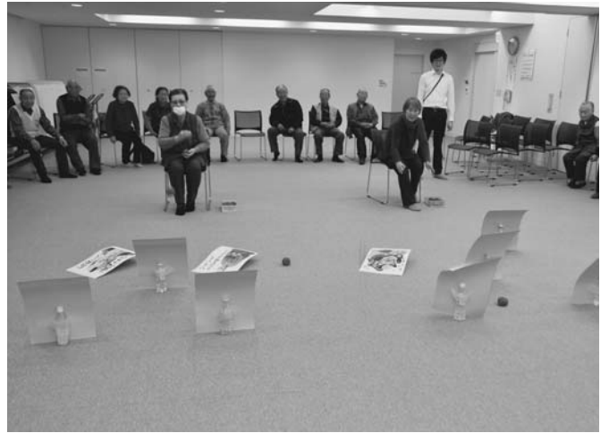
1/17 今年1回目のふれあい昼食交流会が保健センターで開催されました。この日は、日頃の運動不足の解消を目的に新聞紙を使った玉入れなどのレクリエーションを実施。その後は過去の同交流会の様子を写したフィルムも流され、参加者は懐かしんでいました。