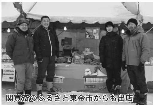
関寛齋のふるさと東金市からも出店