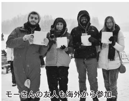
モーさんの友人も海外から参加