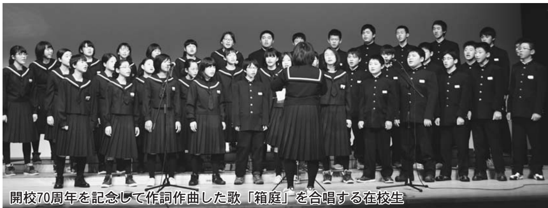
開校70周年を記念して作詞作曲した歌「箱庭」を合唱する在校生