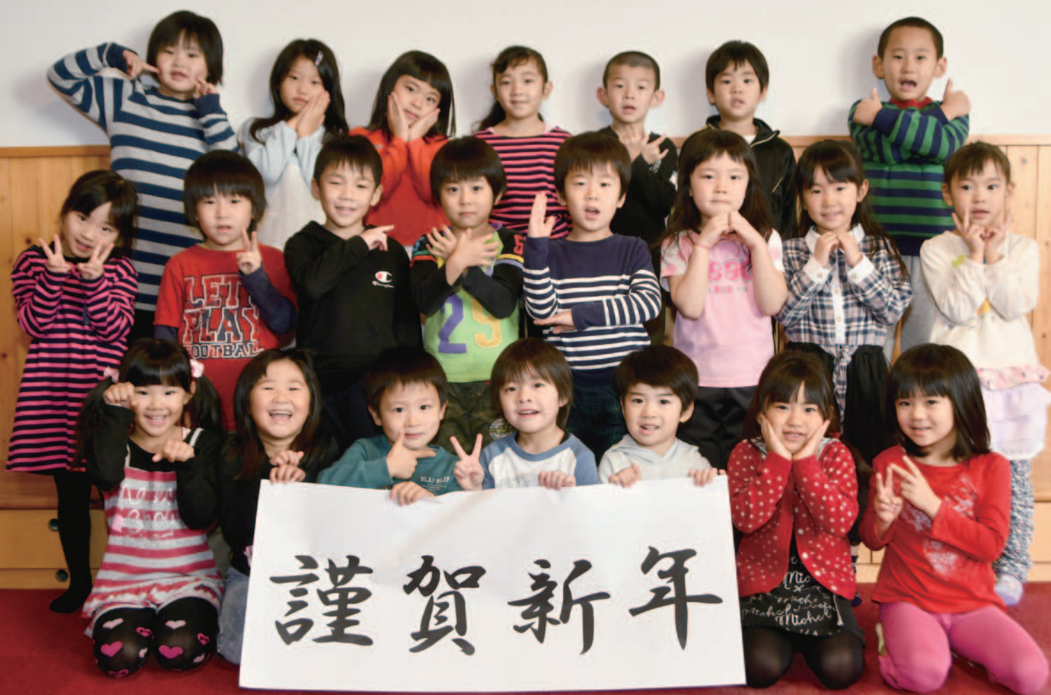
陸別保育所「きりん組」のみなさん 春から新1年生です（3ページで紹介します）