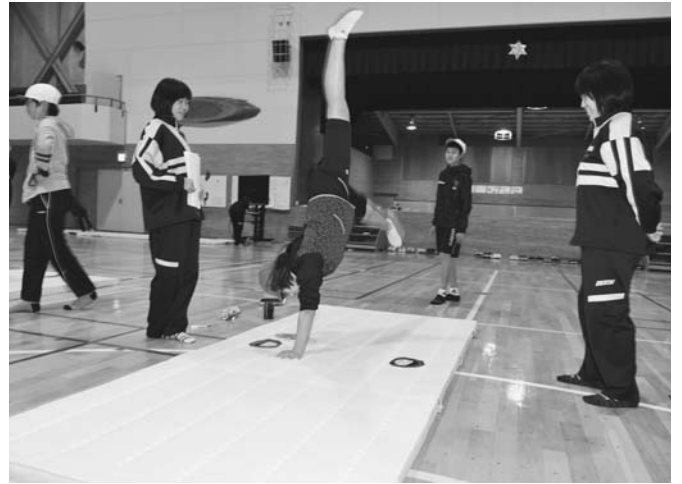
11/21 今年度の陸別中学校教育研究大会が陸別中学校で開かれました。小中連携の公開授業として陸小6年生の体育（マット運動）を、陸中3年生が付き添い熱心に実技を指導しました。