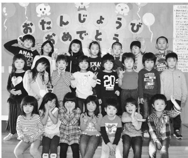
掲載した皆さんは、平成29年12月末現在で町内に住民登録があり、平成23年4月2日から平成24年4月1日までに生まれた方です。