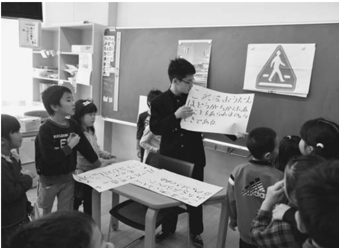
11/28 総合の授業として、陸中1年生が陸小1年生を対象に陸小で交通安全教室を実施しました。陸中1年生は3グループに分かれ、それぞれ交通安全のクイズ、交通安全講座、O×クイズを行い、交通安全の重要性を教えました。