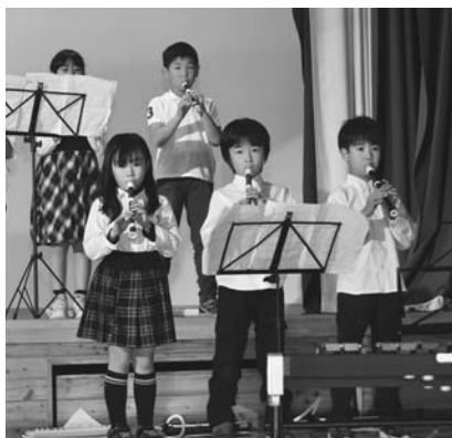
3年「ジブリがいっぱいコレクション」