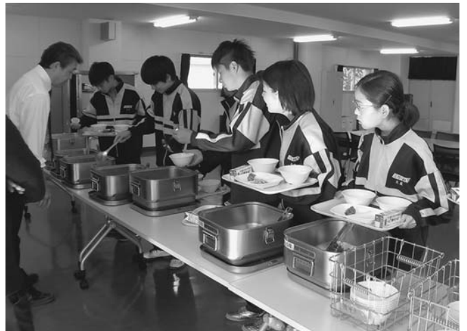
10/5 毎年開催している、中学3年生を対象とした「バイキング給食」が実施されました。この給食は、おかずやデザートを通常より数品増やし、一足早い卒業記念として行われたもので、生徒は普段とちょっと違う給食を楽しんでいました。