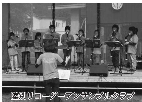
陸別リコーダーアンサンブルクラブ