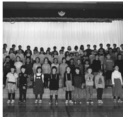
全校合唱「地球星歌」