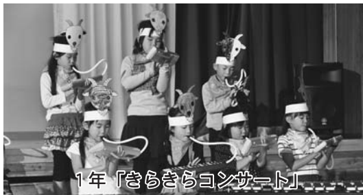
1年「きらきらコンサート」