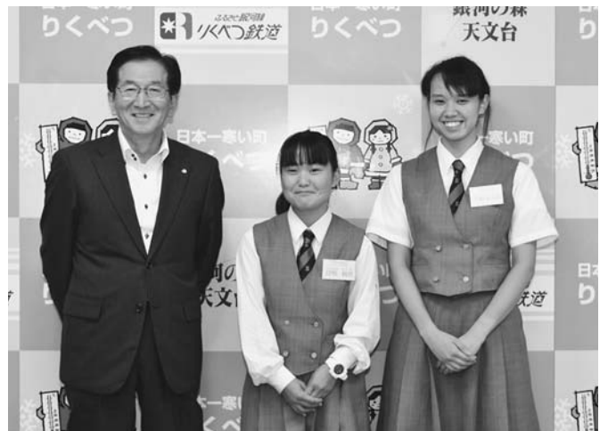
9/26・27 足寄高等学校より、同校の生徒2人がインターンシップ（職場体験学習）の為に、2日間の日程で陸別町役場町民課と教育委員会で、職場体験されました。