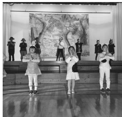
2年 劇「歌のきれいな王さま」

発表会は、恒例の1年生による口上から始まり、各学年が劇や器楽など練習の成果を発表しました。6年生は、劇「バッテリー」を披露。児童の熱演に会場からは大きな拍手が送られました。