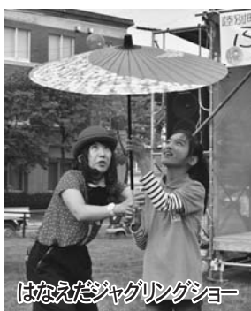
はなえたジャグリングショー