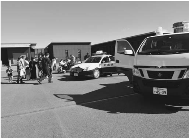
10/13 陸別小学校で、初となる本別警察署主催の「りくべつ安全・安心フェスティバル」が開催されました。パトカーに白バイの展示、子ども制服体験や鑑識体験では、普段体験できない鑑識作業を実際におこないました。