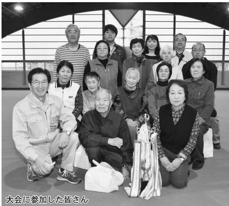
大会に参加した皆さん