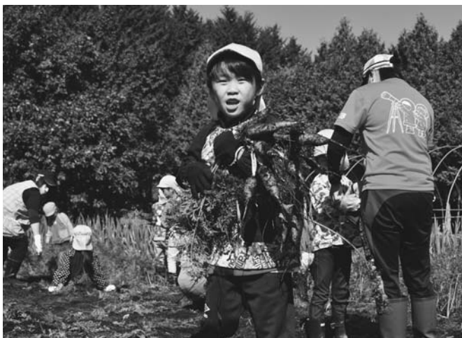
10/3 陸別保育所園児が、給食センター裏の畑で栽培された人参と長ネギの収穫を体験しました。園児は、次々と人参と長ネギ抜いていき、あっという間に収穫が終わり、充実した笑顔浮かべていました。