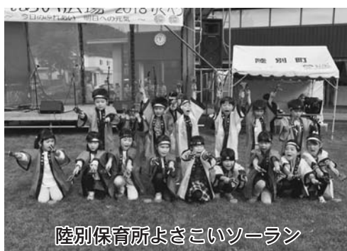
陸別保育所よさこいソーラン