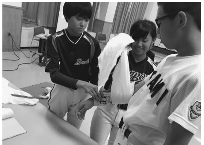
9/9 救急の日として、9月9日を含む1週間を「救急医療週間」とした普及啓発事業の一環として、救急講習が陸別消防署で開催されました。救急蘇生法についての正しい知識や技術の普及を図り、傷病者の救急率の向上等に寄与することを目的としています。