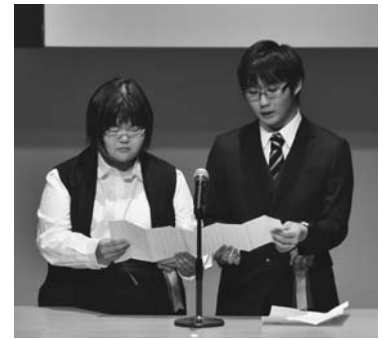
新成人による明日への誓い