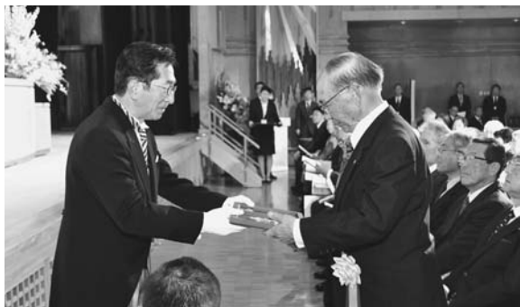
開町100年記念感謝状贈呈