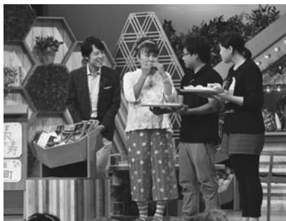
陸別町の特産品紹介