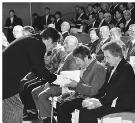
永住者特別功労記念品の贈呈

9月23日、陸別町開町一〇〇年記念式典が町タウンホールで開催され、町内外から約250人が出席しました。