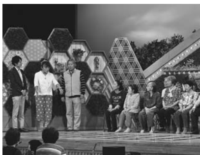
ふまねっと運動紹介