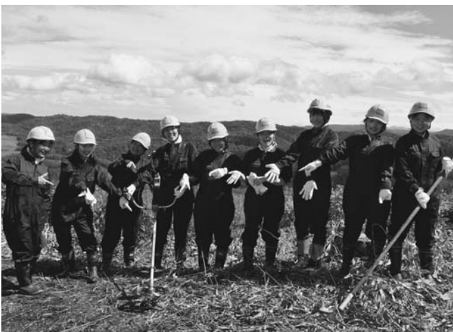
9/3~7 今年で3回目となる「陸別町新農林業人材発掘プログラム事業」による農林業体験が5日間の日程で開催されました。酪農体験や林業体験のほか、陸別町の町内施設の見学などのプログラムが行われました。