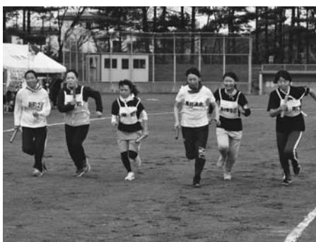
自治会対抗リレー

8月26日 第51回町民スポーツレク大会が町民運動場で開催されました。 今回は、昨年と同じ12チームが出場。子供からお年寄りまで町民420人が晴天の中、各競技で心地よい汗を流しました。 大会は、僅差で昨年優勝の農村連合チームを共栄第1チームが振り切り、見事、優勝を飾りました。