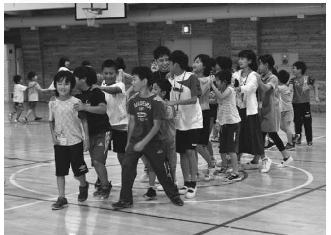
8/23 今年も千葉県酒々井町の児童20人が陸別小学校を訪問し、児童と交流しました。この訪問は今年で5回目で、児童は2泊3日の日程で滞在。コテージ村に宿泊し、天文台やりくべつ鉄道など陸別を満喫しました。