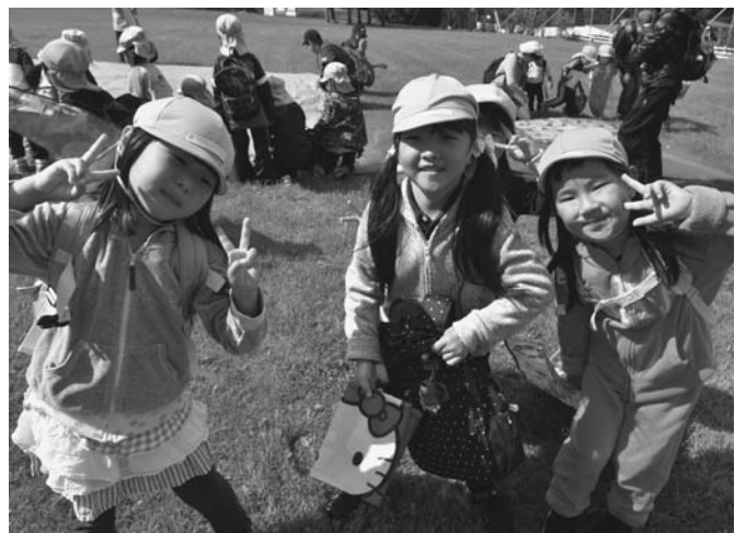
9/11 陸別保育所の秋の遠足が行われました。この日は保育所を出発してイベントセンター前に到着。オフロード同乗体験をした後はお弁当を食べて、広い広場で元気に遊びました。