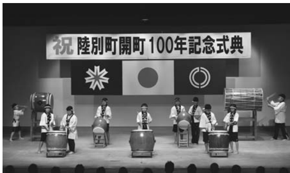
オープニングを飾った太鼓演奏