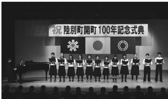
陸中1年生と3年生による町歌斉唱