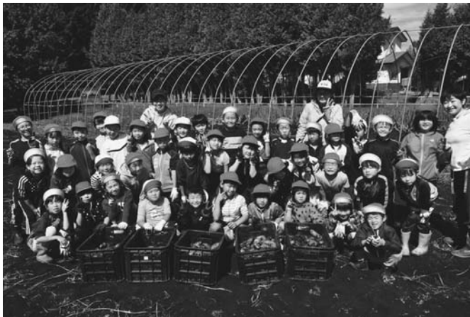
9/11 陸小1・2年生が給食センターで栽培されたジャガイモを収穫しました。毎年、食育の一環として行われ、児童は大きく育ったジャガイモを一生懸命掘り出していました。