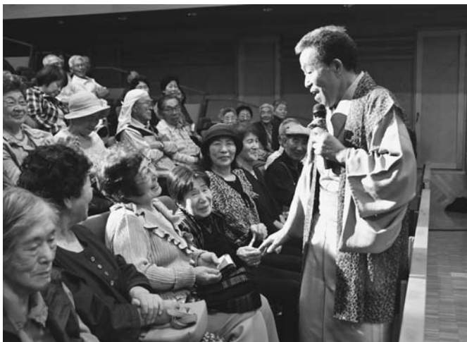
9/14 今年度の敬老会が開かれ、「孫」の大ヒットで知られる大泉逸郎さんによる歌謡ショーが行われました。会場には230人が集まり、同世代でもある大泉さんのトークと歌声に、大きな拍手と歓声を送っていました。