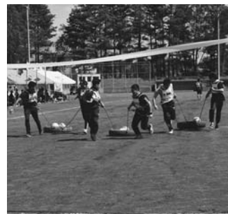
ニッサン・オフロードレース