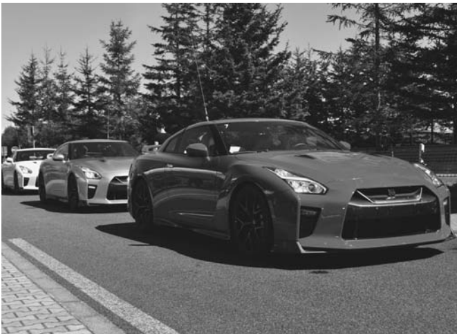
9/2 日産自動車陸別試験場で、同試験場の開設30周年を記念し、テストコースオープンデーを開催しました。町内外から約300人が来場し、「GT-R」車の高速走行同乗体験には多くの人で賑わいました。