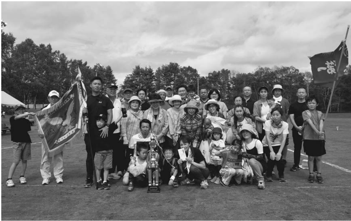
優勝した共栄第1チーム