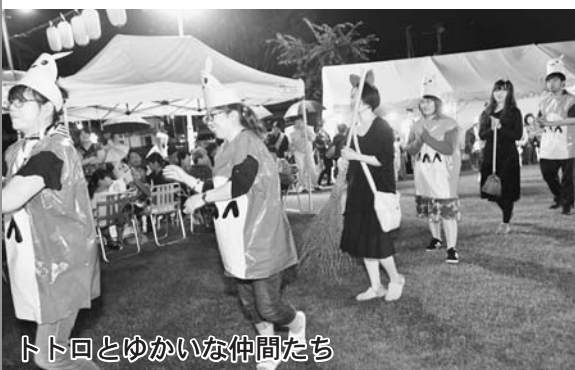
トトロとゆかいな仲間たち