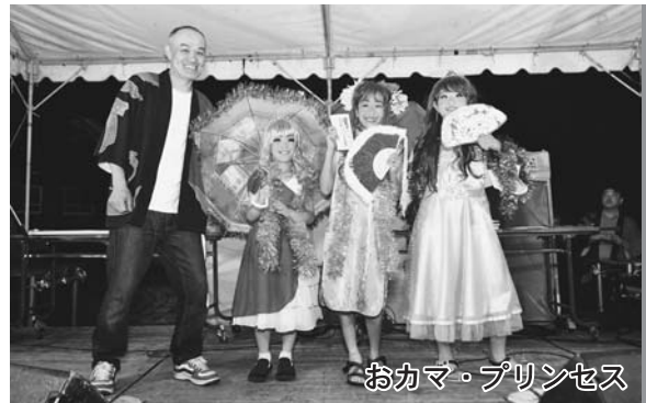
おカマ・プリンセス