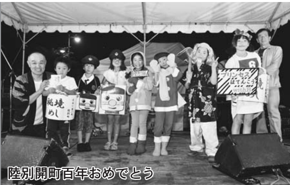
陸別開町百年おめでとう