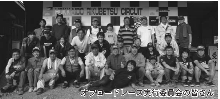
オフロードレース実行委員会の皆さん