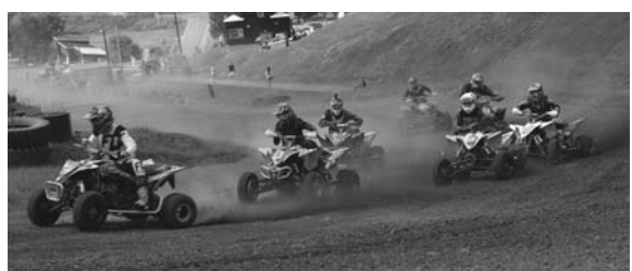
各レースは激しいバトルとなり、

8月5日 第37回道新オフトロードレースin陸別全日本選手権大会が今年も陸別サーキットで開催され、フォーミュラバギー25台、ATV29台による迫力のレースを観衆約1200人が楽しみました。 この日は、真夏日となり、砂ぼこりが舞う厳しいコンディションとなりました。