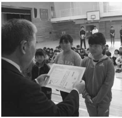
これは自分の読んだことの