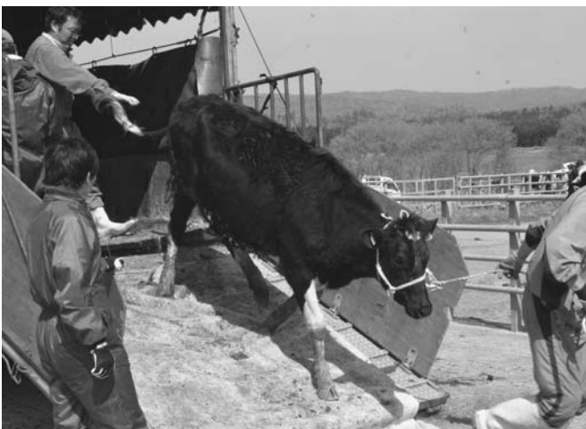
5/20 町内ポントマムの畜産センターへの入牧が始まり、町内の酪農家から集まった1,030頭の牛が消毒や予防接種を受けて放牧されました。牛たちは10月中旬くらいまでセンターで過ごし、畜主のもとへ戻っていきます。