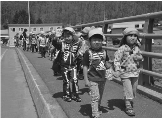
5/19 晴天の中、陸別保育所の遠足が行われました。園児は陸別保育所を出発し、目的地のわかばスケート場に到着。元気いっぱい遊びました。