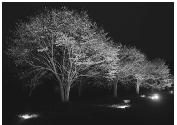
5/12 上斗満地区のエゾヤマザクラが開花し、待ちわびた町民らが、町内では貴重な桜を楽しみました。この日は観光協会によるライトアップも行われ、家族連れなどが夜桜見物に訪れました。