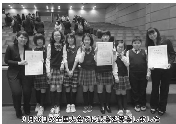
3月26日の全国大会では銀賞を受賞しました

昨年度は陸別リコーダーアンサンブルクラブの活動にご協力くださり、ありがとうございました。