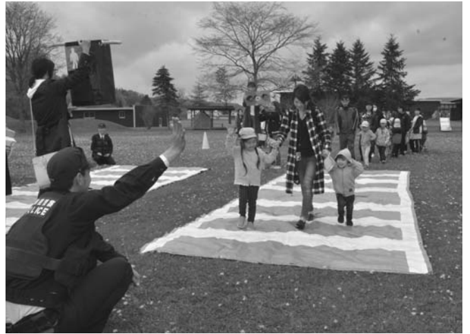
5/23 こぐまクラブによる交通安全教室が保育所で行われました。教室では横断歩道を再現して、正しい横断歩道の渡り方や信号の見方を園児に説明しました。