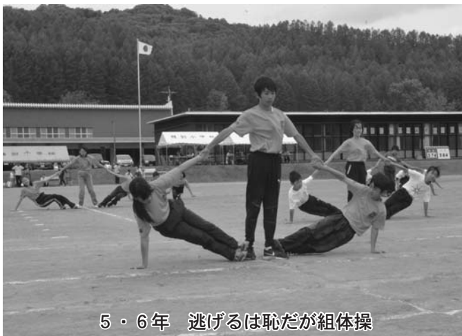
5・6年 逃げるは恥だが組体操