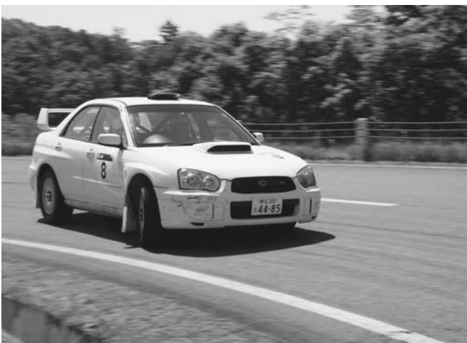
6/18 ラリー競技「スーパーターマックプラス2017」が銀河の森などで行われました。今回は舗装路と林道の複合コースが設定され、全国から参加した47台のラリー車が豪快な走りを見せていました。