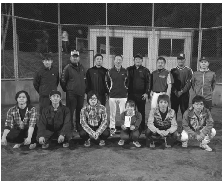
優勝した「REビューティーズ」