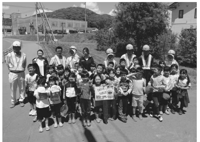
6/13 陸別町商工会が参画するイエローリボンプロジェクトに係るひまわりの種まきが行われ、陸別小1・2年生が参加しました。この取り組みには毎年、礪石橋建設が地域貢献活動の一環として協力し、同社社員が児童に種まきを指導しました。