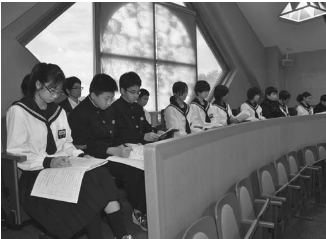
6/15・16 陸別中学校の生徒が地域のことを学ぶ授業の一環として町議会6月定例会の一般質問を傍聴しました。生徒は、町長と議員のやりとりを肌で感じながら熱心にメモを取っていました。