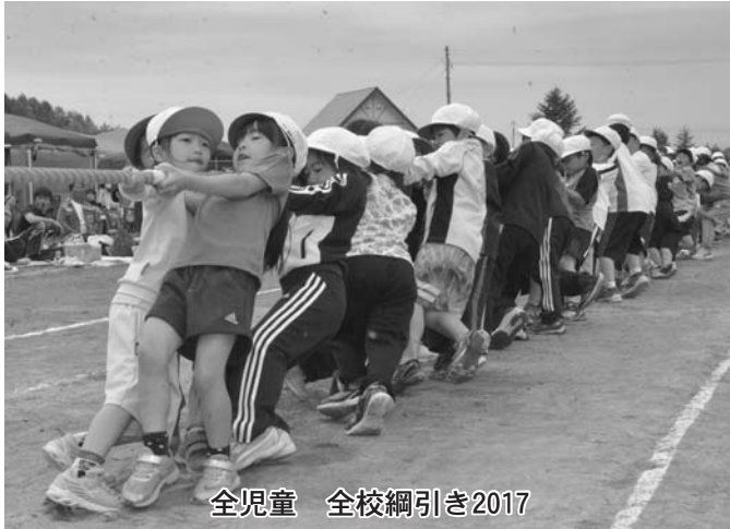
全児童 全校綱引き2017