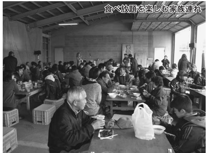
食べ放題を楽しむ家族連れ