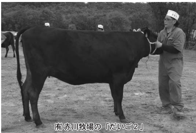
(有)赤川牧場の「だいご2」