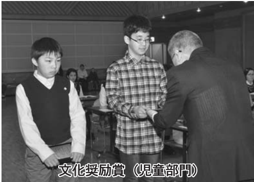
文化奨励賞（児童部門）