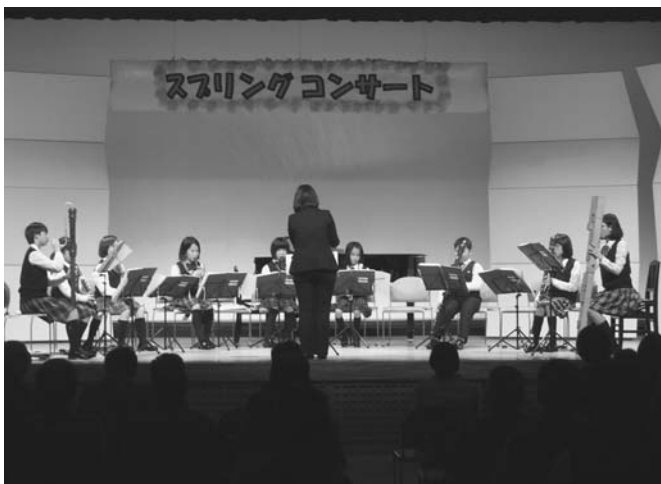
3/18 全国コンテストへ出場する陸別リコーダーアンサンブルクラブの壮行演奏会を兼ねた第8回定期演奏会がタウンホールで開かれ、コンテストで演奏する「プレイフォード組曲」など全13曲を披露しました。