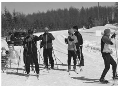
参加者による記念撮影（写真上） 緩やかな登り坂が続くコース前半 （写真右） 休憩ポイントの様子（写真下）