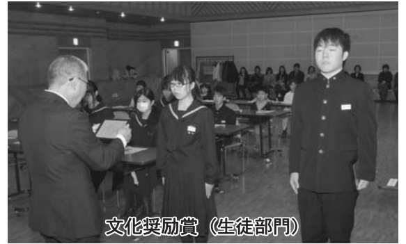
文化奨励賞（生徒部門）