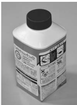
※容器部分もプラスチックの例