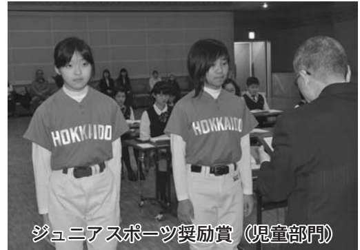
ジュニアスポーツ奨励賞（児童部門）