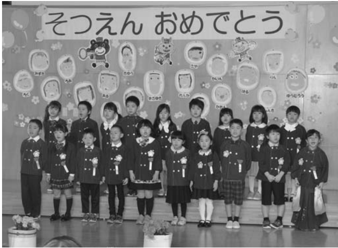
3/27 平成28年度陸別保育所卒園式が行われました。卒園する園児19人は、卒園証書を受け取って、感謝の言葉と将来の夢を元気に発表。在園児や先生、家族が紙吹雪で卒園を祝いました。