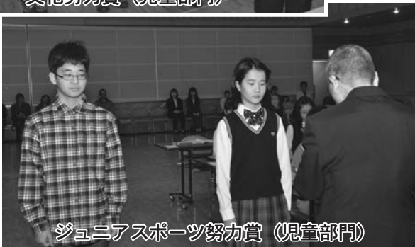
ジュニアスポーツ努力賞（児童部門）