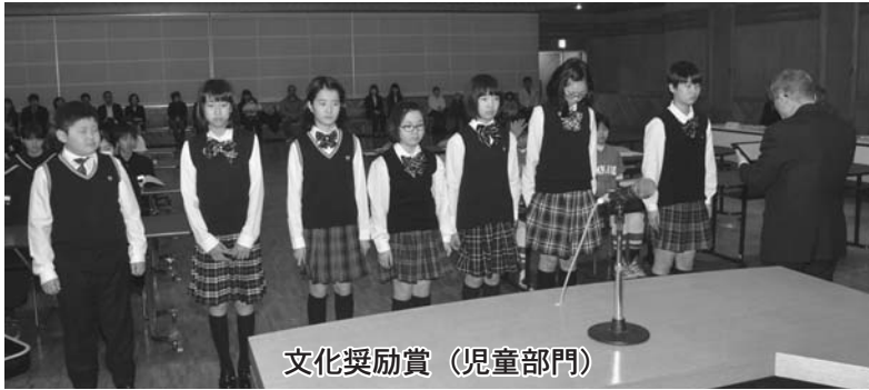
文化奨励賞（児童部門）