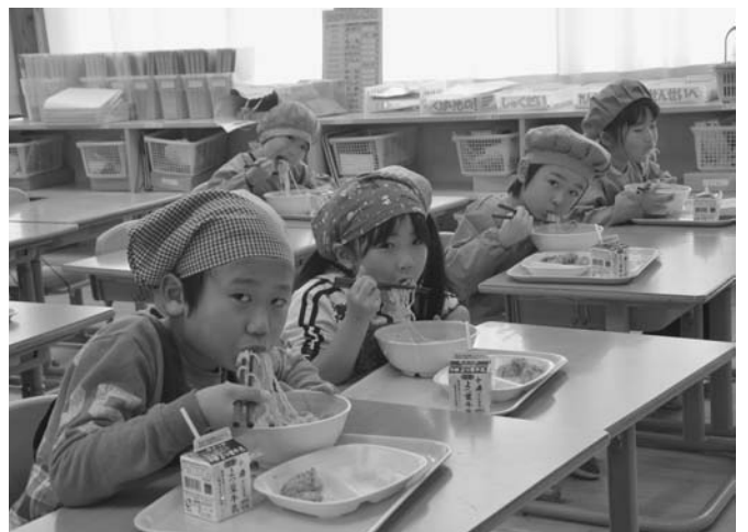
3/9 今年度の北海道給食調理コンクールで優良賞を受賞した鹿肉みそラーメンが、学校給食に登場しました。児童は、おいしいと言いながら勢いよく麺をすすり、満足な表情を見せていました。