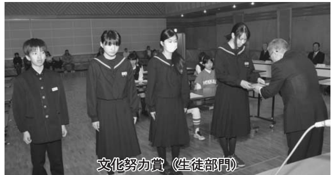
文化努力賞（生徒部門）