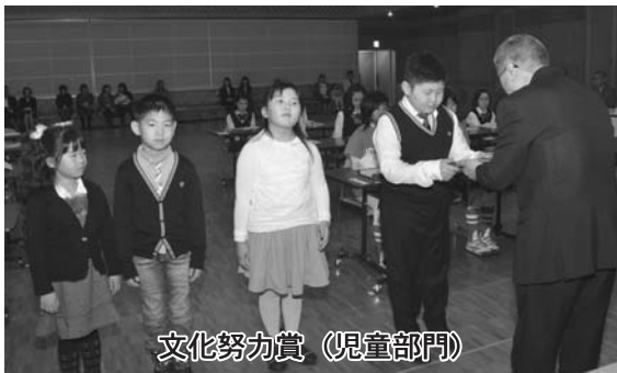
文化努力賞（児童部門）