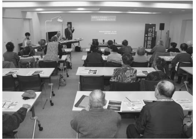
2/22 ふれあい昼食会が保健センターで開かれ、総務省が行う行政相談制度について、釧路行政評価分室担当者と秋山行政相談員から説明がありました。参加者は、日頃困っていることなどを相談していました。