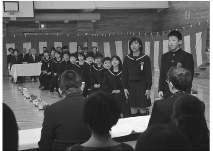
3/24 陸別小学校第107回卒業式が行われました。卒業生14人は、保護者や在校生らが見守る中、森校長からしっかりと卒業証書を受け取り、6年間の思い出が詰まった校舎に別れを告げました。