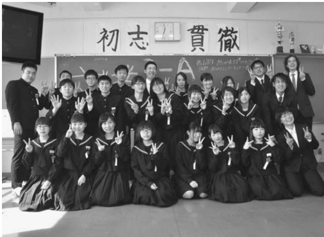
3/15 陸別中学校第70回卒業式が行われました。卒業生21人は、式見校長から卒業証書を受け取り、3年間の思い出を胸にお世話になった先生や在校生、家族に感謝の気持ちを伝えていました。