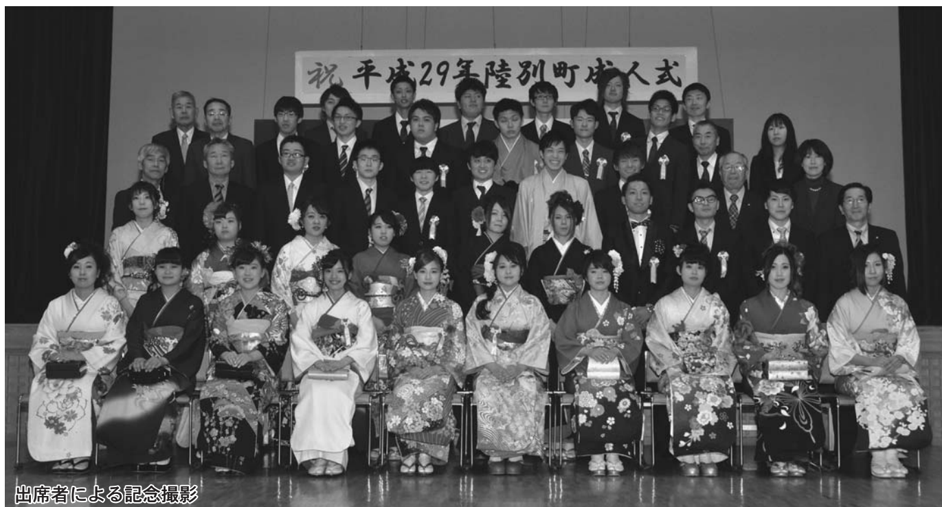
出席者による記念撮影