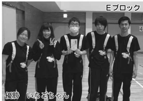
優勝 いちごちゃん