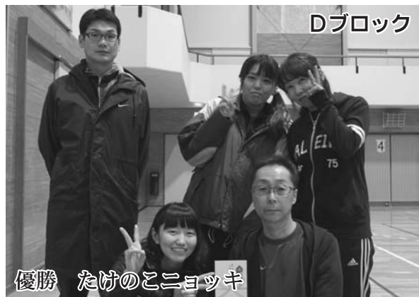
優勝 たけのこニョッキ