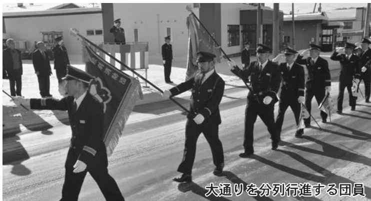
大通りを分列行進する団員