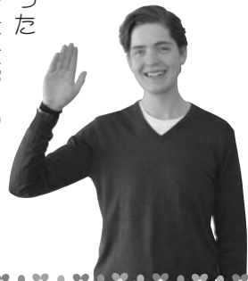
あまり寝れなかった

22日の午後から北海道に冬の嵐が上陸し、14時00分までの全ての便が欠航になってしまいました。バスは19時00分ごろ新千歳空港に到着しましたが、空港には飛行機を待つ何千もの乗客がいました。温泉は満室で宿泊はできませんでした。列車も雪のため、遅れたり運休になっていました。翌日の便がどうなるのか分からない状態で、搭乗手続きの係の人からは当日朝早く来てほしいと言われました。ボクは一晩中空港の床で寝ることにし、朝まで待つことにしました。