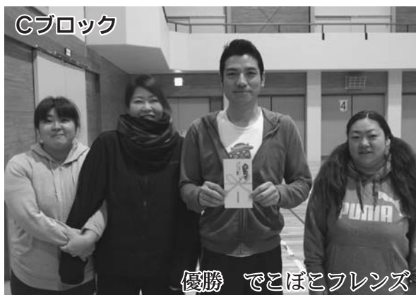
優勝 でこぼこフレンズ