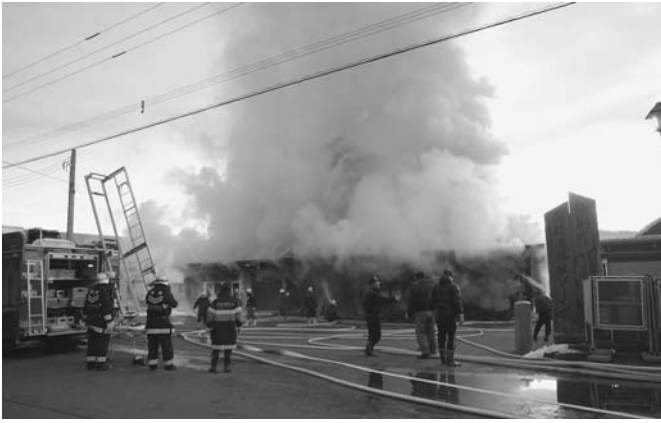
11/25 陸別町高齢者共同生活支援施設「福寿荘」で午前7時20分ごろ火災が発生。午後2時35分に鎮火しましたが、施設は全焼し、3名の方が避難などの際に負傷しました。今後、施設の再建を急ぎ、管理に万全を期します。火災に際し、避難誘導等にご協力頂きました地域の皆さまに厚くお礼申し上げます。