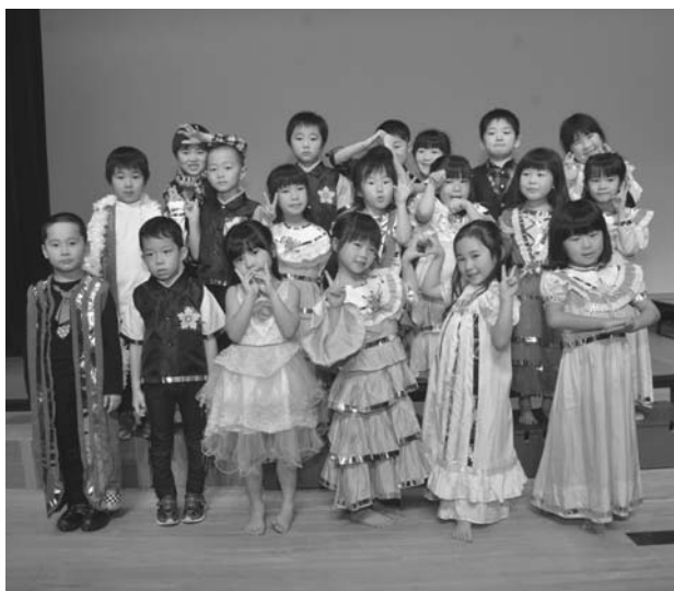
掲載した皆さんは、平成28年12月末現在で町内に住民登録があり、平成22年4月2日から平成23年4月1日までに生まれた方です。

本町が更なる飛躍を遂げるために町民の皆様と対話する機会を増やし、町づくりに全力を傾注してまいりますので一層のご理解とご協力をお願い申し上げます。結びに町民皆様のご多幸を心よりご祈念申し上げます。年頭のご挨拶といたします。