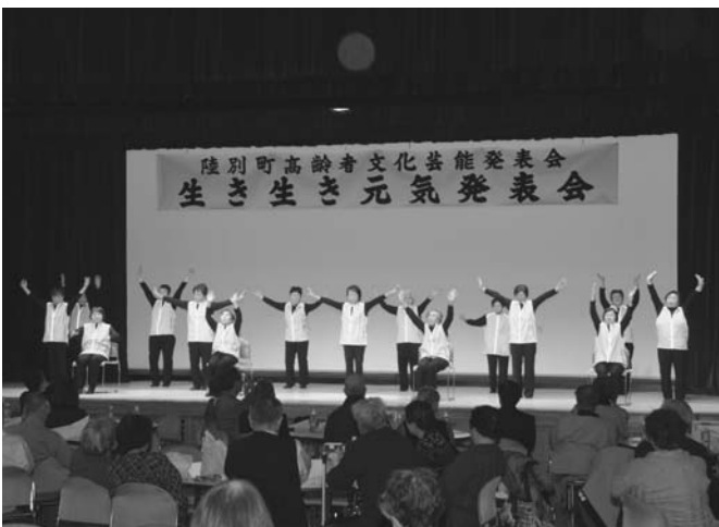
12/2 生き生き元気昼食会・発表会がタウンホールで開かれ、270人が参加しました。昼食会では陸別婦人会が準備した炊込みご飯と豚汁が振る舞われ、発表会では9組がハンドベルやカラオケ、体操やコントを披露しました。